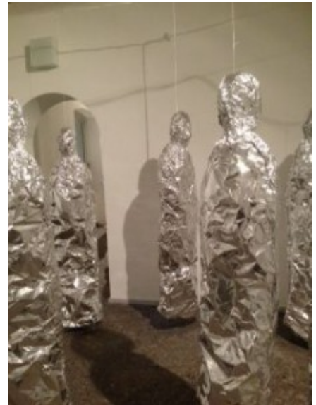
Raum-Klang-Skulptur „Exuviae“ von Yoshi Shibahara.

durch den höchst produktiven Mix der Kunstformen. Traditionelle Theater-Erfahrungen werden unterlaufen – etwa von der Düsseldorfer Ben J. Riepe Kompanie, die an jedem Tag des Festivals vier Räume neu und anders bespielt. Zur Eröffnung am Samstag waberten Kunstnebel und Obertöne durch die weißen Räume; die Darsteller standen, hockten, lagen oder gingen, einzelne Töne singend, umher. Während sich die Klänge vereinten und mal traumhaft-melancholische, mal schrille Mehrstimmigkeit produzierten, strömte ein Dutzend gut erzogener Hunde neugierig schnuppernd zwischen Besuchern und Performern umher – eine Einladung, Augen und Ohren zu öffnen und den Kopf ganz frei zu machen von Erwartungen.