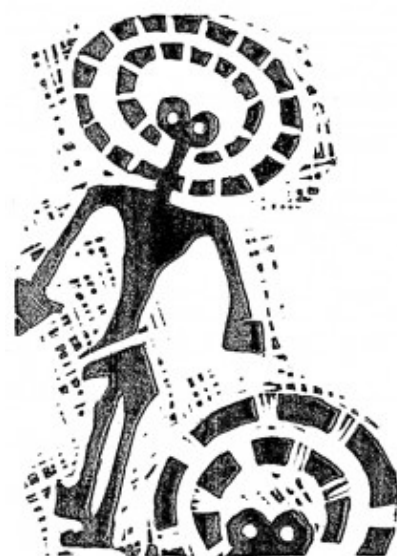
Illustrationen: Gine Selle

„Ausflug ins Exil“, so der Titel, basiert auf Gine Selles Erlebnissen und Erfahrungen bei einem Kunst-Aufenthalt in Chile. Es ist die teils unglaubliche, teils phantastische, mal traurige, mal schockierende Geschichte ihrer chilenischen Gastgeberin, die der Deutschen in langen Gesprächen ihr Leben und ihre Erfahrungen im deutschen Exil schilderte. Gine Selle verwebt diese Geschichten mit ihren eigenen Erlebnissen, mit ihrer Sicht auf das heutige Chile.