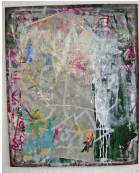
Brand, o.T., 2011, © Galerie Jacky Strenz

bevorzugt Brand Bildträger mit sichtbarer Geschichte – bedruckte Stoffe, vom Maler gefunden, dabei aber eher ausgewählt als aufgelesen.