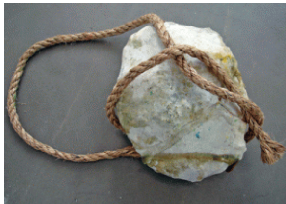
Brand, o.T., 2011, © Galerie Jacky Strenz

Als Äquivalent des zeitgenössischen iBrains ist auf Brands Gemälden Komposition durch Kakophonie ersetzt. Einzig gemeinsames Merkmal von Farbe und Material ist ihre gleichzeitige Anwesenheit in diesem Bild- bzw. Kopfträger. Organisches und Synthetisches, Schrilles und Zartes stehen so unvermittelt nebeneinander wie widersprüchliche Gedanken.