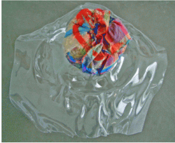
Brand, o.T., 2011, © Galerie Jacky Strenz