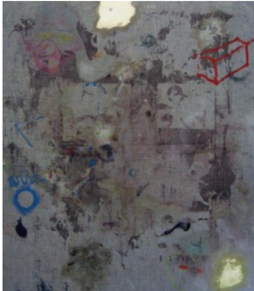
Brand, o.T., 2010, © Galerie Jacky Strenz

Jede Leinwand enthält eine Vielzahl visueller Metaphern für Entstehung und Wandlung von Denkprozessen. Während die wenigsten Verbindungen gerade, d.h. folgerichtig verlaufen, dominieren tastende, planlos mäandernde Linien das Terrain. Sie beginnen zaghaft oder grandios, stottern, verblassen, leuchten auf, schleichen aus, brechen ab, kreuzen, schließen und verknoten sich. Zuweilen treten sie auf der Stelle, umfahren die einmal geglückte Form wieder und wieder – Lieblingsgedanken, die wir immer dann zitieren, wenn uns zu neuen Problemen nichts Neues einfallen will.