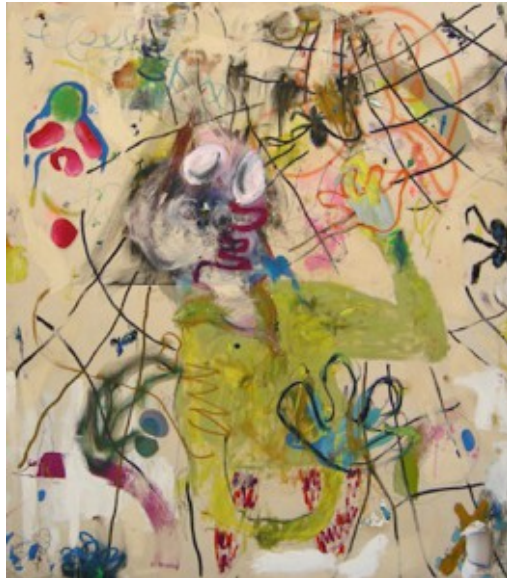
Brand, o.T, 2008/09, © Galerie Jacky Strenz

Als Äquivalent des zeitgenössischen iBrains ist auf Brands Gemälden Komposition durch Kakophonie ersetzt. Einzig gemeinsames Merkmal von Farbe und Material ist ihre gleichzeitige Anwesenheit in diesem Bild- bzw. Kopfträger. Organisches und Synthetisches, Schrilles und Zartes stehen so unvermittelt nebeneinander wie widersprüchliche Gedanken.