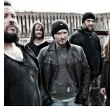
The Very End

2008 fand es ebenfalls im Drucklufthaus statt, dann folgten zwei Jahre Pause.