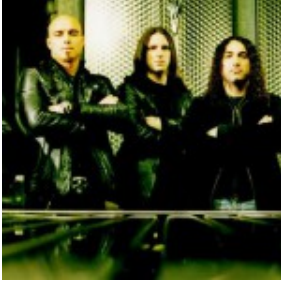
Night In Gales