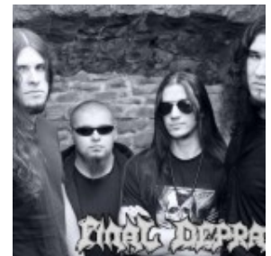
Final Depravity

An dem Tag werden elf Bands zu sehen sein. Der Eintritt ist mit fünf Euro günstig.