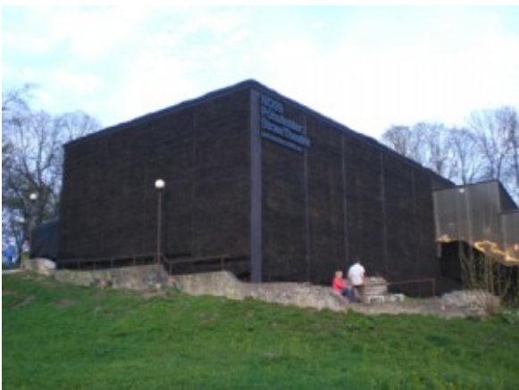
Strawtheatre in Tallinn 2011

Köln hat gefühlte 100 Theater, Tallinn in Estland macht den Eindruck, es bestünde aus Theatern. 400 000 Einwohner und überall stehen Theater, die auch besucht