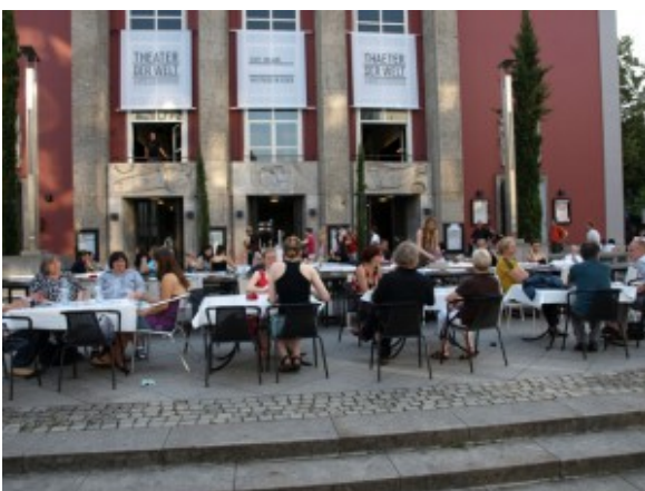
Festival Theater der Welt am Essener Grillotheater

In der Politik, besonders auch in der Kulturpolitik, zählt das Gebäude. Das sieht man auch daran, dass sie früher mal besetzt wurden, an mancher Stelle auch wieder heute, aber in einer symbolischen Form. Man drängt also in ein Gebäude und sagt: „Wir sind Künstler und wir brauchen Raum, besonders diesen hier.“ Und je nach Wetterlage, wird den Besetzern zugehört. Und man sagt: „Sehet her! Hier sind junge Leute, die brauchen Raum. Kümmern wir uns darum!“ Für den Kunst geneigten Politiker ist das eine schöne Plattform, die er erst wieder verlässt, wenn sich alles auflöst und letztlich wird der Raum einer Logistik-Firma übergeben oder gar der Selbstverwaltung überlassen, was in der Regel bedeutet, dass der Mensch sich übernimmt und am Ende wieder auf seinem Sofa sitzt.