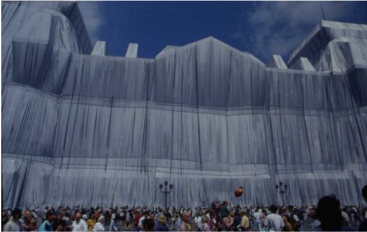
Der verhüllte Reichstag 1995.