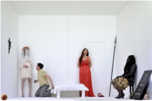
Symbol- und Gedanken-Raum: Klingsors Reich im Entwurf Harald Thors in Wuppertal.

Der zweite Akt in einem weißen (Gedanken-)Raum lässt sich als innerer Reifungsprozess Parsifals lesen – mit Kundry als rotgewandeter Fantasiegestalt des herausfordernden Weibes, einer verschleierte Dame, die sich zum Schluss als Klingsor-Transe entpuppt, und einer bräutlichen Gestalt, die man als Erscheinung von Parsifals Mutter Herzeleide lesen kann. Dennoch: Szenisch kann Wuppertal mit Thilo Reinhardts Phantasmagorie weit eher punkten als Essen vor zwei Jahren mit Jochen Schlömers verqueren Konstrukten.