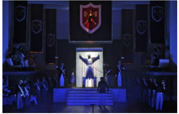
Amfortas – das Opfer: Die Szene der „Gralsenthüllung“ in Thilo Reinhardts Deutung von Wagners „Parsifal“ in Wuppertal.

Der Gral: Amfortas, ein Alt-68er mit wirren langen Haaren, ist das kostbar mit einem priesterlichen Mantel geschmückte Opfer. Einer, der einst einen Fehler gemacht hat. Er wird auf einem Blech wie ein Gekreuzigter montiert. Die ausgestreckten Arme, kunstvoll aufgeritzt, spenden das Blut, das livrierte Pedelle auffangen und den Rittern kredenzen. Die Schüler saufen derweil das Blut, das herabrinnt und sich am unteren Blechrand in einer Rinne sammelt. Ein verstörendes Bild ungenierter Brutalität. Champagner schwebt herab, ein Foto zur Erinnerung beendet das Ritual.