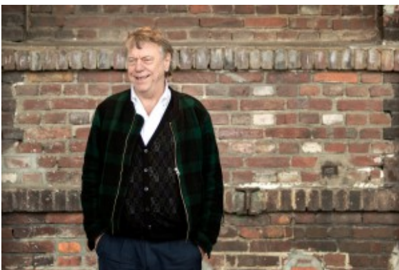
Ruhrtriennale-Intendant Johan Simons

In diesem Programm vermengt Klassik sich mit Pop und Zwölftönerei, um im nächsten Schritt auch noch elektronisch verfremdet zu werden, dort löst sich die Oper in eine Rauminstallation auf, und wenn schon nicht atemberaubend Crossovermäßiges auf die Spielstatt gestellt wird, dann sind zumindest doch Sprachenkenntnisse hilfreich, um fremdsprachige Schauspieltexte verstehen zu können. Immerhin sind deutsche Untertitel versprochen.