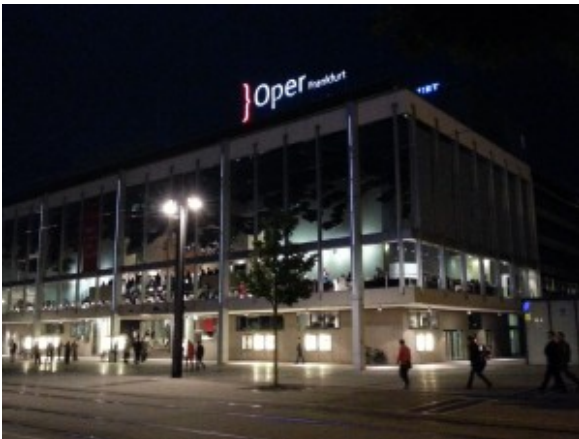
Die Frankfurter Oper.

geschrieben von Werner Häußner | 6. August 2015