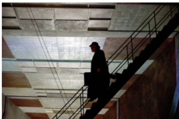
Einsamer Flüchtling: John Tomlinson in der Oper „Murder in the Cathedral“ in Frankfurt.

der weltlichen Macht auf die Kirche zu kämpfen? Oder überlässt er sich und sein Schicksal ganz dem Willen und der Lenkung Gottes?