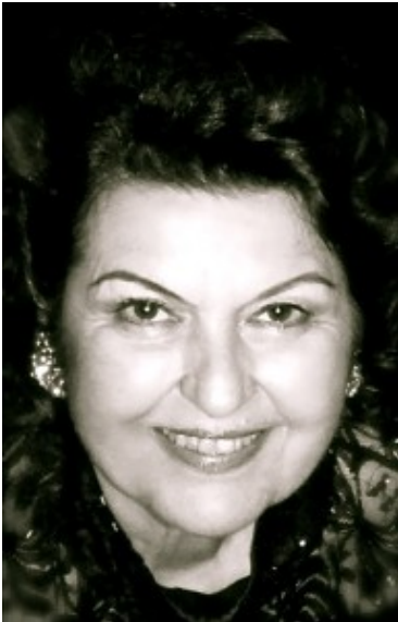
Helen Donath

Begonnen hat alles, so erzählte sie einst August Everding in einer seiner berühmten „da capo“-Sendungen, mit dem Film „The great Caruso“ von 1951. Helen wollte singen wie Mario Lanza im Film und eignete sich die Tenor-Arien an. Als sie 14 war, gastierte George London in ihrer Heimatstadt – und sie nahm sich ein Herz und sang ihm „Vesti la giubba“ vor – das ergreifende Solo des Canio aus Ruggiero Leoncavallo „Pagliacci“. London muss ziemlich irritiert gewesen sein: Er fragte das Mädchen, was für ein Stimmfach sie denn sei, und Helen antwortete, ziemlich hilflos, mit einem Begriff, den sie vom Programmheft von Londons Konzert abgeschaut hatte: „I am a lady baritone“.