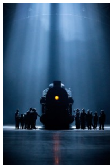
Furchterregend, jetzt im Container: die Lokomotive aus „Neither“.

Kommen wir zum Jahr 2014. Die beste Inszenierung der Jahrhunderthalle, also des Gebäudes selbst, war bisher wohl 2006, in der Ära Flimm, Bernd Alois Zimmermanns „Soldaten“ in der Regie von David Pountney. Hier war die Bühne (je nach Blickwinkel) wenige Meter tief und einige hundert Meter lang oder umgekehrt, und das Publikum fuhr auf schienengebundenen Zuschauerrängen an dieser Bühne hin und her, immer dorthin, wo gerade etwas los war. Hier wurde das Stilmittel Kamerafahrt für die Bühne auf atemberaubende Art zur „Publikumsfahrt“ adaptiert. Und man „er-fuhr“ die riesige Halle.