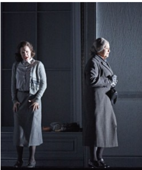
Helen Donath (rechts)

Das zeichnet nicht nur ihre Mozart- und Strauss-Aufnahmen aus. Helen Donath hat sich nicht um neue Musik und nicht um seltene Partien gedrückt. In Köln sang sie in Boris Blachers verschwundener Version des „Romeo und Julia“-Stoffs. In Hannover in Werner Egks ebenso vergessener „Verlobung in San Domingo“. Sie war Luise in Hans Werner Henzes damals brandneuer Oper „Der junge Lord“, sang später auch in Ernst Kreneks „Karl V.“ und in Hans Pfitzners „Palestrina“. Vor neuer Musik hat sie keine Angst: Wer mit Mozart umgehen kann, kann alles singen, ist ihr Bekenntnis. Und mit fortschreitendem technischem Verstehen habe sie auch aktuelle Musik für sich entdeckt – von Aribert Reimann bis John Corigliano.