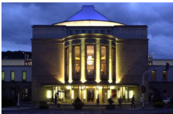
Opernhaus Wuppertal.