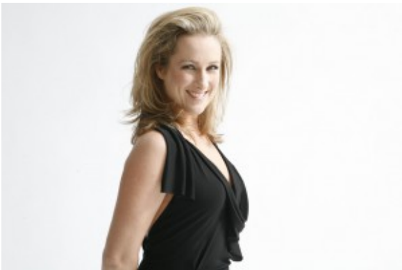
Diana Damrau.