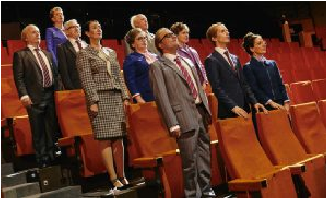
Szene aus Christoph Marthalers Audimax-Inszenierung „Nach den letzten Tagen. Ein Spätabend“