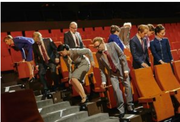
Weiteres Szenenbild

Klar ist, dass dies ein behutsamer Abend ist. Aktionsverwöhnte werden eher in ein Fragezeichenkoma versetzt. Auch sind die Texte nun vielen nicht ganz unbekannt und sicherlich ist diese direkte Art, uns zu sagen: „Achtung! Wehret den Anfängen!“ ein bisschen platt. Wenn es nicht so still wäre, könnte man sagen: Agitprop. Aber sicher erschrickt der eine oder andere und erwischt sich dabei, manche Idee, manchen Satz mit einem gedachten „Ja genau!“ zu begleiten. „Ach herrje, was denke ich denn da?“