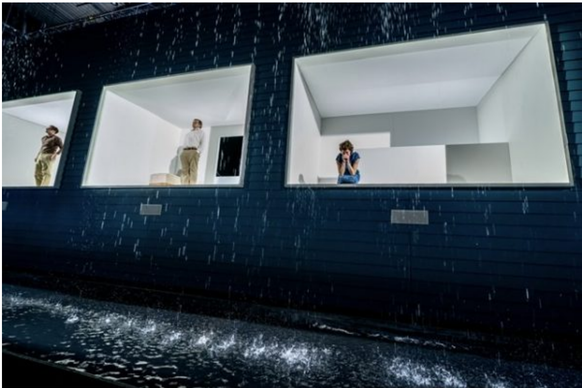
Regen, Regen, Regen: Szenenbild aus der Kölner O'Neill-Aufführung.

geschrieben von Eva Schmidt | 19. März 2020