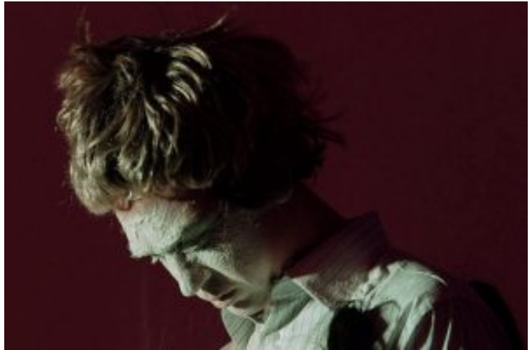
Lars Eidinger als Peer Gynt