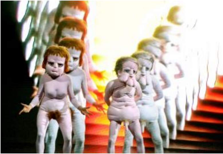
Adam und Eva als Puppen