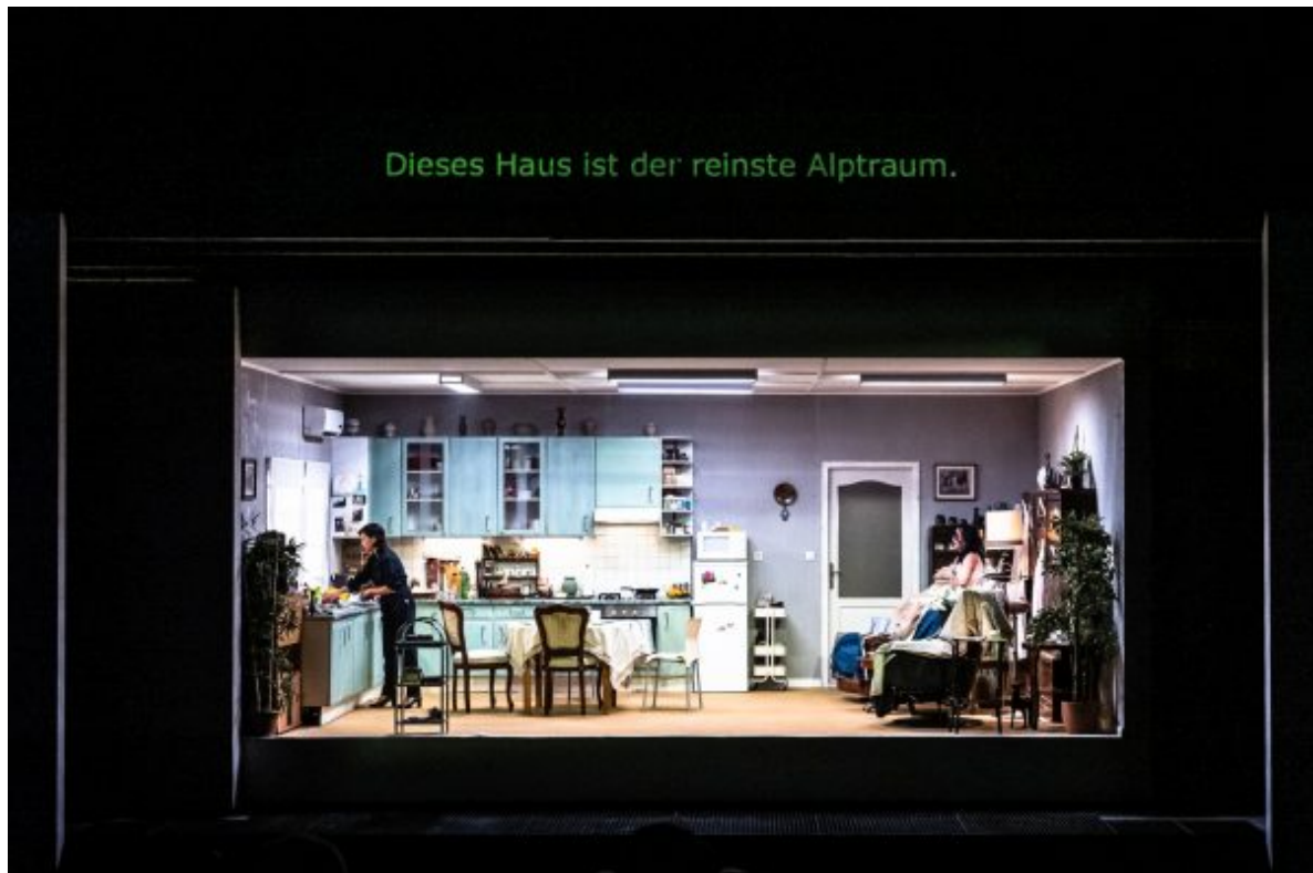
Weiteres Szenenbild der Inszenierung.