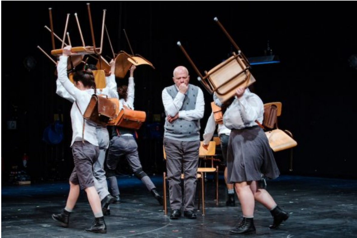
Szene aus „Kind of“.