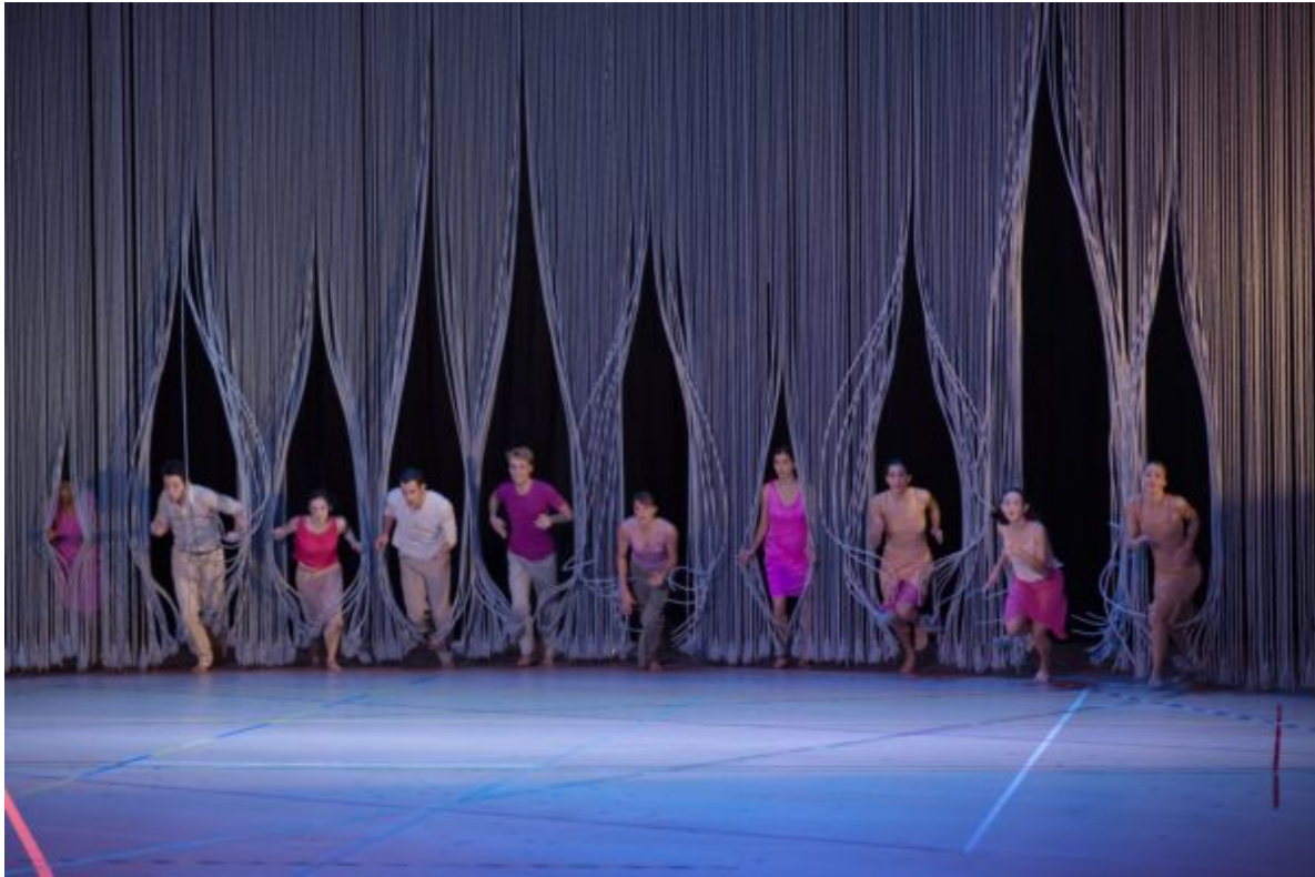
Szene aus Anne Teresa De Keersmaekers Choreographie „Rain (live)“.