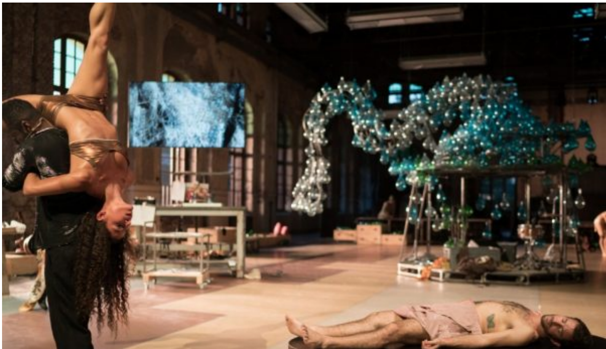
Szene aus „All the good“

geschrieben von Rolf Dennemann | 19. März 2020