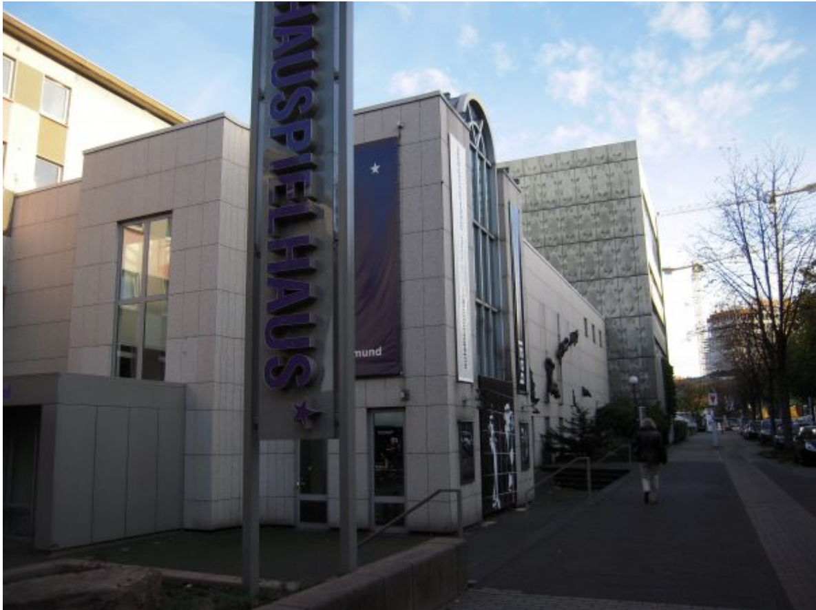
Blick aufs Dortmunder Schauspielhaus.