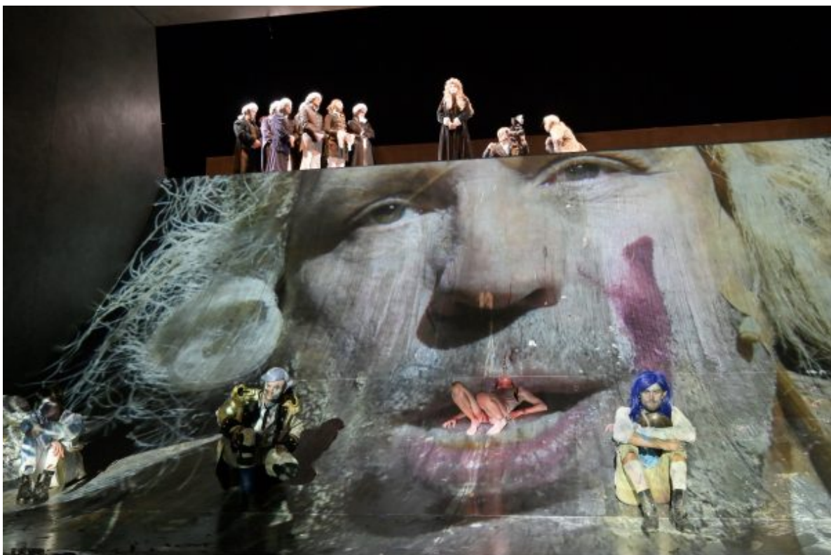
Szenenbild aus „Dantons Tod“.

geschrieben von Eva Schmidt | 19. März 2020