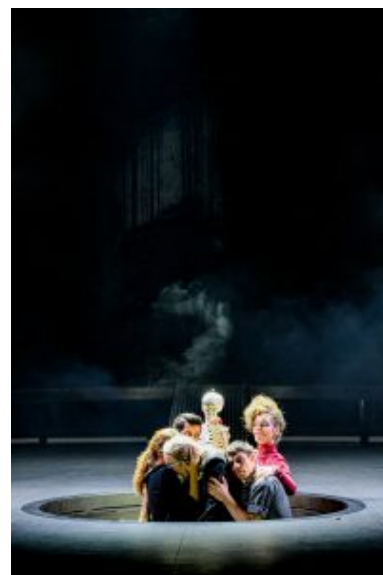
Abwärts: Die Untoten in bizarrer Umklammerung.

Karin Henkels Konzept, der Gefühlskälte der Menschen einen eisigen Mantel umzulegen, geht über weite Strecken auf. Manche Längen stören indes: Die Szene im Nachtclub etwa, mit schier endlosem Conférencier-Gequatsche, gerät ärgerlich zäh. Und das roboterhafte Wiederholen ganzer Sätze wirkt nicht gerade zwingend. Weit problematischer aber ist, dass die Fokussierung auf alles Abstrakte, Mechanische und Grausige im Umgang mit Horváths Figuren sich unbefriedigend eindimensional präsentiert.