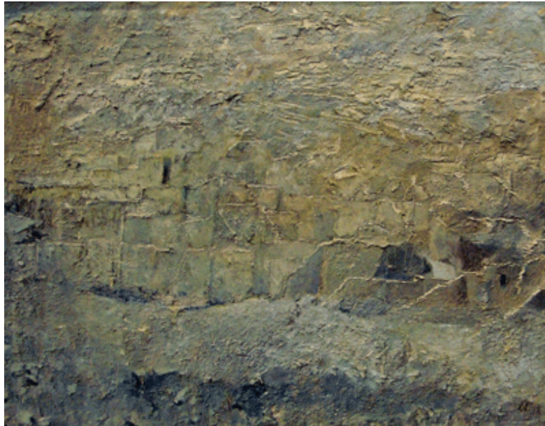
Schlotter "Die kleine Stadt Huayacan", 01, Mischtechnik

Der Verzicht auf Einzelheiten aber bedeutet keine wirkliche Reduktion, sondern bietet Raum für einen erstaunlichen Detailreichtum der Struktur einer Oberfläche, die keine ist. Aus einer Mischung von Sand, Gips und Farbe (oder so) entstehen Reliefs, die den Blick vollständig vom Inhalt („Leeres Kaufhaus“, „Das große Wäscheproblem“ etc.) auf die Form lenken. Das Auge kriecht in Furchen und stolpert über die Leinwand verkrustende Plateaus, deren Fülle erdfarbiger Nuancen einem denkbar unbunten Spektrum entstammt. Schlotters Palette beschränkt sich so konsequent auf Farbfamilien, wie sie allenfalls oberhalb der Vegetationsgrenze oder 40° Celsius in der Wüste vorkommen, dass es nicht überrascht, dass der Maler seit 1960 einen zweiten Wohnsitz im spanischen Alicante unterhält.