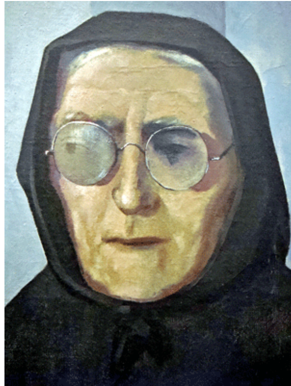
Schlotter "Die Frau des Metzgers", 1958, Öl auf Lwd., Foto CL

Szenarios ohne Personen hingegen wirken symbolisch, dabei aber polyvalent – eher Pittura Metafisica als bedeutungsschwangere Redseligkeit. Zurückgelassene Gegenstände und leere Interieurs erzählen von etwas, das wir nie erfahren werden. Angesichts der Verteilung von lesbaren Details und freien – nicht leeren – Flächen drängt sich ohnehin der Eindruck auf, dass es dem Maler weniger um den rekonstruierbaren Plot ging als darum, das Geplauder der Einzelheiten räumlich einzudämmen und den größten Teil der Leinwand dem freien Spiel von Farbe und Schatten zu widmen.