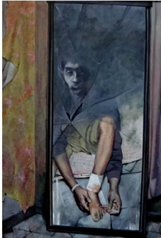
Schlotter "Der selbständige Sohn des Metzgers", Öl auf Lwd.

Eine allgegenwärtige physiognomische Asymmetrie lässt auf die zwei Seelen, ach, der ProtagonistInnen schließen. Gesichts- und Körperhälften sind selten synchron: ein Auge ist müde, das andere lüstern, ein Mundwinkel hebt, der andere senkt sich.