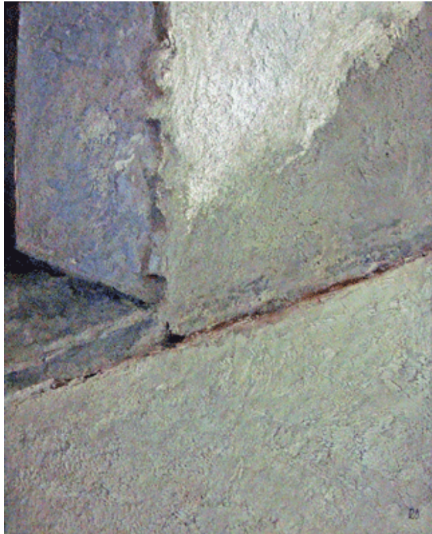
Schlotter "Herein ohne anzuklopfen", 04, Mischtechnik

Fazit: Normalerweise bin ich nicht so freigiebig mit Beifallsstürmen, aber diese Ausstellung ist faszinierend. Dabei hab ich die ganze Druckgrafik gar nicht erwähnt. Und das ist gut so, denn ein Blog ist kein Katalog und Schlotter muss man offline sehen. Fahrt mal nach Darmstadt (sic)!