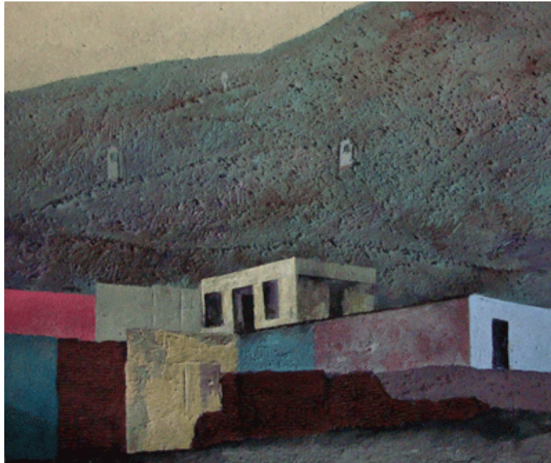
Schlotter "Gropius was here", 1999, Mischtechnik

Die Personendarstellungen aus den 1950er bis 70er Jahren hingegen sind bunter, aber nicht farbenfroh, denn Dunkles dominiert – in jeder Hinsicht. Auch hier lenkt das weggelassene Beiwerk die Aufmerksamkeit auf die psychogrammartigen Porträts. Nahezu alle Gesichter erinnern auf ihre Weise an Masken: das bizarre Make-up Jugendlicher Mitte der 80er Jahre, der bevorstehende Tod im aufgelösten Gesicht eines Heroinabhängigen, das subtile Sabbern des angetrunkenen Lustmolchs im Frack.