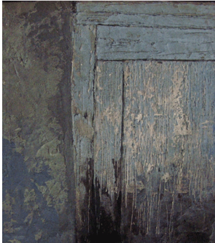
Schlotter "Die graue Tür", 00, Mischtechnik, Foto CL

Beim Betreten der Halle erleide ich einen Anfall akuter Maulsperre: Der Unterkiefer sackt und lässt mich eine Weile intelligenzfrei an die Wände starren. Der Wow-Faktor hat zugeschlagen.