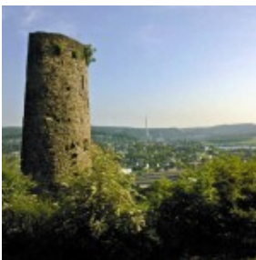
Ruine der Burg Volmarstein über der Ruhr.

Das Revier bestand ja nicht immer aus Industrie und Handwerk, sondern war, wie überall sonst in Deutschland, zunächst ein Bauernland. Daran soll dieser kleine Exkurs ins späte Mittelalter erinnern, genauer gesagt, an das Jahr 1315.