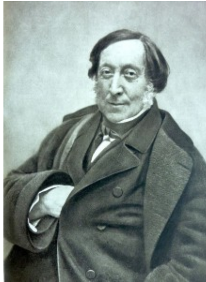
Gioachino Rossini.

Tenor. Auch Rosita Fiocco würde man gerne wieder hören, auch wenn die Koloraturen noch etwas schwer im Ansatz gebildet sind. Antonio Petris' Regie bemühte sich ohne Erfolg, dem Werk eine interessante Seite abzugewinnen. Ausnahmsweise mal ein Rossini, der für die Bühne zu Recht vergessen werden kann.