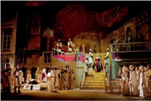
Szenenbild Zweiter Akt der Leipziger „Feen“.