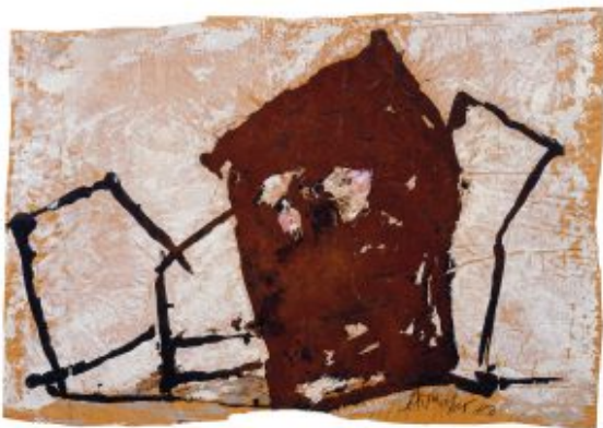
Emil Schumacher: „G-35/1980“ (1980), Gouache auf braunem Packpapier.

Interessant ist ein Vergleich zweier Darstellungen seiner Ateliers von 1938 und 1983. Auch diese Arbeitsstätten hat er als Schutzräume begriffen, in die einzig und allein seine Frau eintreten durfte. Jahrzehnte eines intensiven und ertragreichen Künstlerlebens liegen zwischen den beiden Fassungen. Immer mehr ist das innere, nicht sogleich sichtbare Wesen der Dinge in den Vordergrund gerückt.