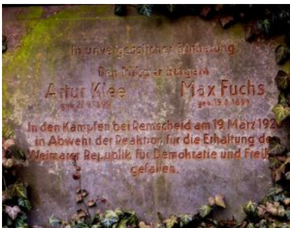
Grabmal der beiden 1920 im

Gedenktage gibt es ja mittlerweile in Unmengen, und dank Wikipedia kann man sich für jeden Tag des Jahres ein Gedenken aussuchen. Allerdings sind diese Anlässe nicht alle in ihrer Bedeutung gleichwertig, und deshalb ist ihre historische und faktische Einordnung auch die Aufgabe guten Journalismus'.