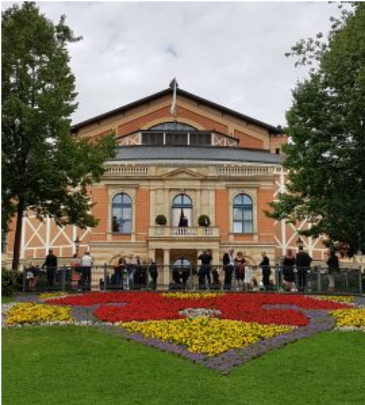
Die frisch renovierte Fassade des Festspielhauses.