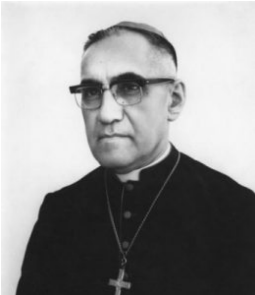
Oscar Romero.

Oscar Romero gilt heute als einer der wichtigsten Träger der Befreiungstheologie, nicht zuletzt, weil bei ihm Lehre und Praxis eine untrennbare Einheit bilden. Was er in Schriften und Predigten verkündete, setzte er konsequent in die gesellschaftliche und politische Wirklichkeit um. Damit machte er sich Feinde auch in seiner eigenen Kirche. Vor allem zwei der Bischöfe in El Salvador griffen Romero öffentlich an, diskreditierten ihn auch auf der Lateinamerikanischen Konferenz der Bischöfe in Puebla, weil er die Verbrechen der salvadorianischen Militärjunta anprangerte. Im Vatikan gab es starke Kreise, die Oscar Romeros Einsatz für die Armen und Unterdrückten missbilligten oder ihn zumindest nicht unterstützten.