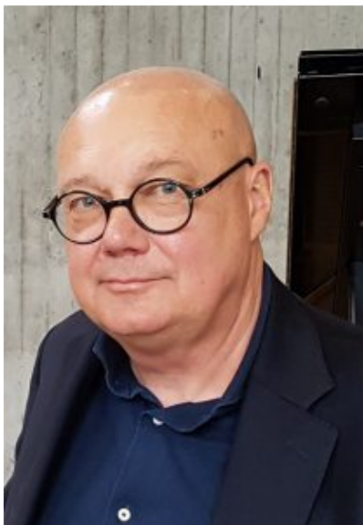
Komponist Manfred Trojahn.