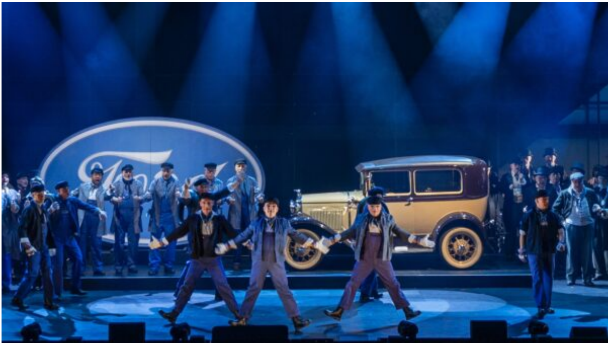
Auch ein Thema: Konrad Adenauer holte als Oberbürgermeister Ford nach Köln.