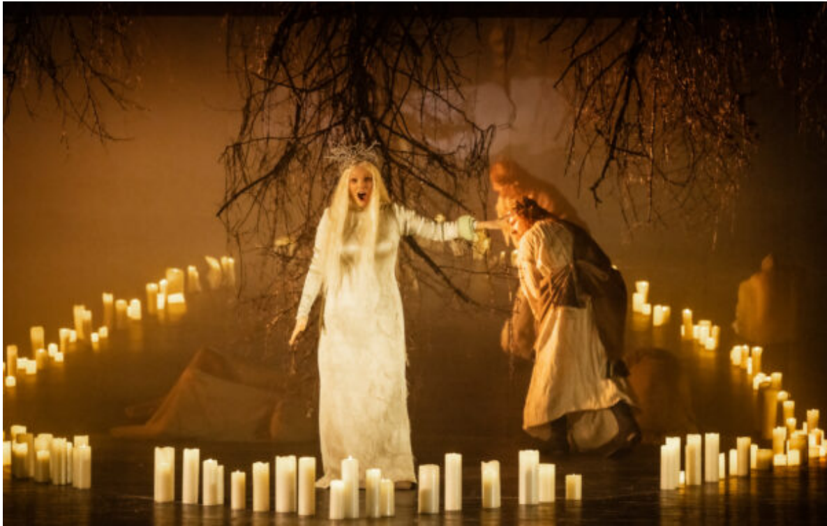
Aus den szenischen Proben zur „Fritjof-Saga“.