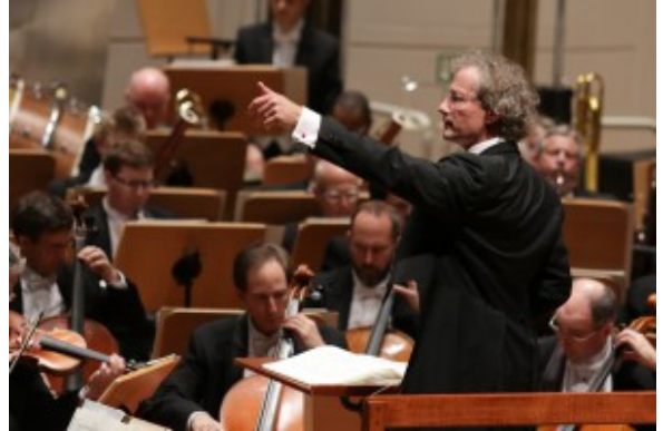
Punktgenaue Einsätze vom Pult aus fürs präzise Orchesterspiel.

Klangbilds im europäisch-amerikanischen Vergleich entwickelt und gefestigt hat. Hier die wärmeren Farben, die bessere Mischung der Valeurs, jenseits des Teiches eine hellere, sehr präsente Tönung, oft auch ein sehr strukturbewusstes Musizieren.