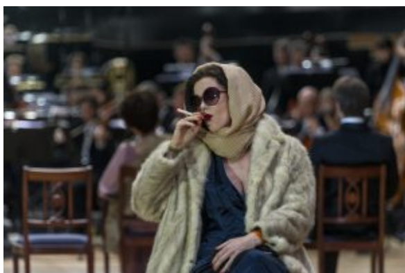
Mélisande ganz mondän, wie eine Filmdiva.

Er nämlich heiratet seine Eroberung, bringt sie zum Schloss, wo sie auf den scheuen Pelléas trifft. Schnell entwickelt sich eine Seelenverwandtschaft zwischen diesen beiden Wunderlichen. Die Liebe, die daraus erwächst, ist eine keusche zwar, doch der wilde Golaud wittert Ehebruch, demütigt und schlägt seine Frau, ersticht schließlich seinen Halbbruder Pelléas. Am Ende gar stirbt Mélisande an der Geburt ihrer Tochter. Was bleibt, ist Erstarrung.