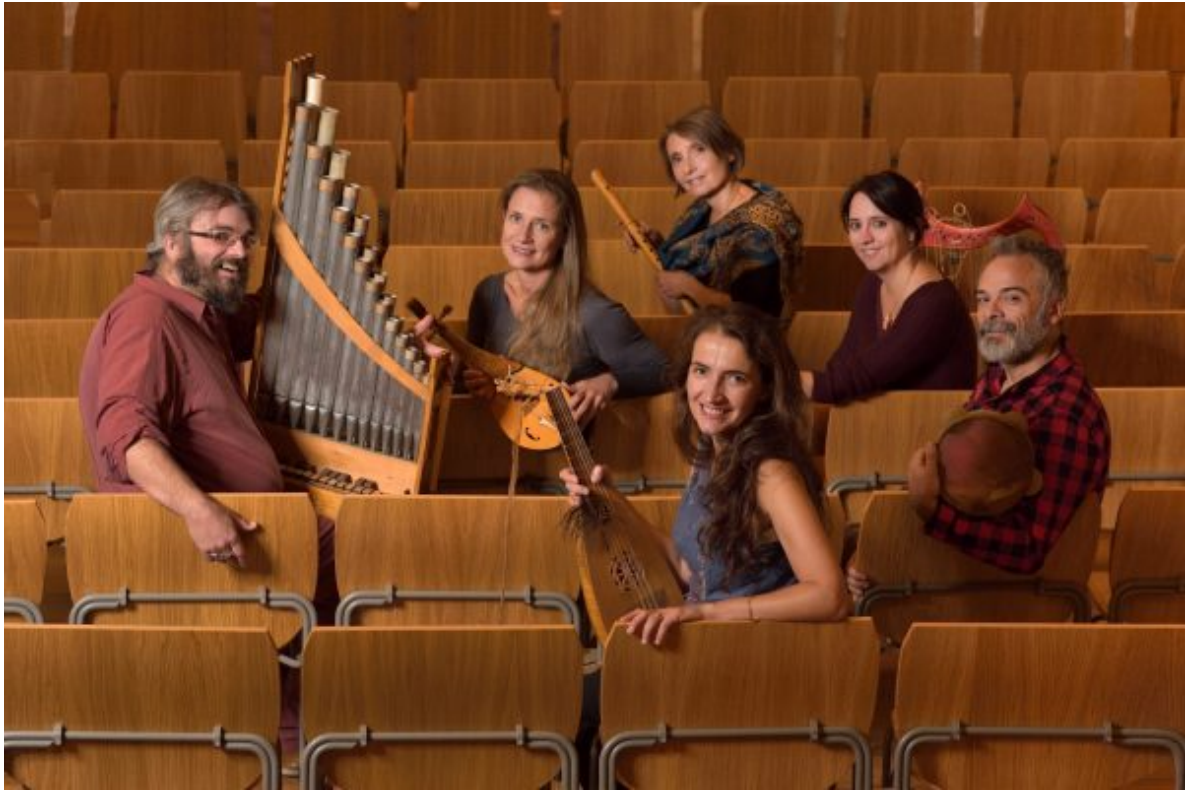
Das Ensemble La Reverdie.

Was sagt uns Musik? Sind die Töne tatsächlich, wie E.T.A. Hoffmann behauptet, das Reich des Ahnungsvollen, Unsagbaren? Ist Musik ein präzises Zeichensystem, eine quasi mathematische Sprache? Hat sie eine Botschaft, die sich wie eine Verlautbarung wiedergeben lässt? Oder entzieht ihr Kunstcharakter sie nicht von vorneherein jeder Festlegung?