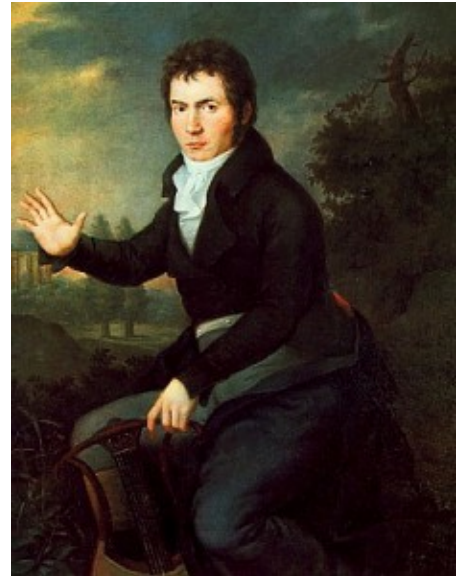
Ludwig van Beethoven zu Zeiten der „Eroica“. Gemälde von Joseph W. Mähler (1805).