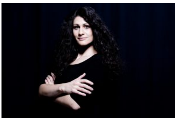
Anja Harteros.