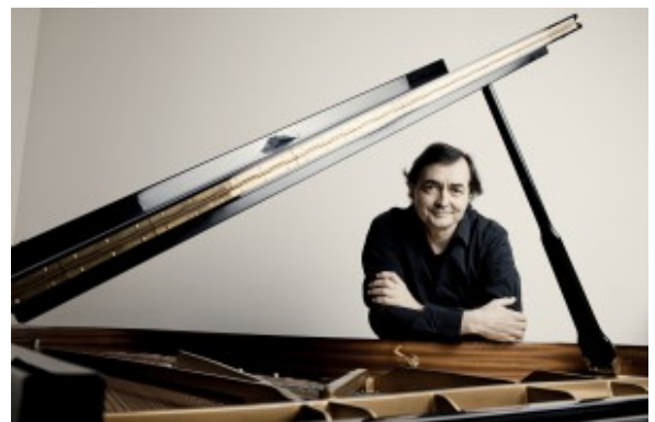
Pierre-Laurent Aimard: ein kluger Kopf, der die musikalische Moderne bei seinen Konzeptkonzerten geschickt in die Historie einbettet.

Der französische Pianist verknüpft zwei Stränge, die das Festival in diesem Jahr als Schwerpunkte ausgegeben hat. Vieles dreht sich dabei um das Thema Etüden, manches um den Ungarn György Ligeti. Der gilt, in Nachfolge Bartóks, gewiss als bedeutendster Komponist seines Landes im 20. Jahrhundert. Und schrieb zwischen 1985 und 2001 ein Konvolut von 18 Klavieretüden. Eine rhythmisch vertrackte, fingerakrobatische, teils klanglich aufreizende Musik, die sich so wahnwitzig wie vermeintlich unspielbar anhört. Dann müssen zehn Finger raschest quirlige Figurationen die Tastatur rauf und runter treiben, und dabei noch die Illusion ungleicher Geschwindigkeiten wecken.