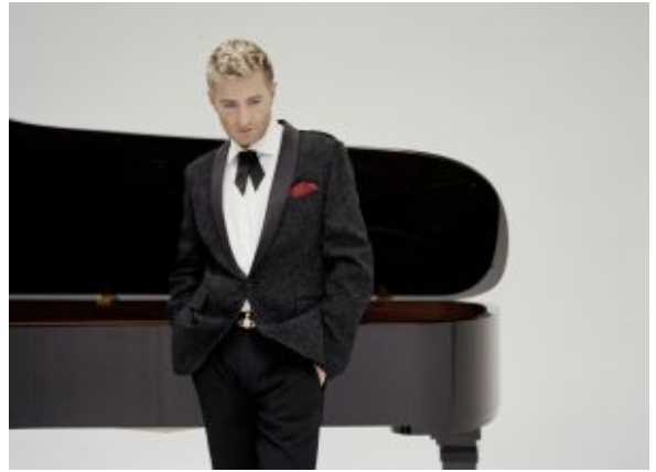
Der Franzose Jean-Yves Thibaudet spielte das „Ägyptische Konzert“ von Camille Saint-Saëns.

Es folgt eine Sternstunde des Pianisten Jean-Yves Thibaudet, der als einer der profiliertesten Saint-Saëns-Interpreten gilt. Diese Kompetenz kommt dem fünften Klavierkonzert des Franzosen („das Ägyptische“) in höchstem Maße zugute. Thibaudet trumpft mit Fingerfertigkeit und brillanter Virtuosität auf, ohne jemals in den Verdacht zu geraten, sich in bloßem Tongeklingel zu gefallen. Mit großem Feingefühl spürt er dem poetischen Tiefgang dieses farbenreichen Klavierkonzerts nach: seinen schillernden Exotismen, gipfelnd in arabischen Tonleitern und einem nubischen Liebeslied, das Saint-Saëns in Kairo den Schiffen auf dem Nil ablauschte.