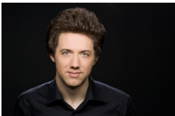
Der Pianist Benjamin Moser.

geschrieben von Werner Häußner | 17. November 2019