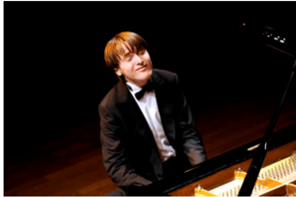
Daniil Trifonov bei seinem Debüt beim Klavier-Festival Ruhr in Düsseldorf

Hymnische Kritiken zu bekommen, ist heutzutage nicht schwer. Die Frage ist immer, von wem. Der 21-jährige Russe Daniil Trifonov hat sie nicht aus einer gut geschmierten PR-Maschinerie, sondern von Kritikern, deren Kompetenz und Unabhängigkeit erprobt sind.