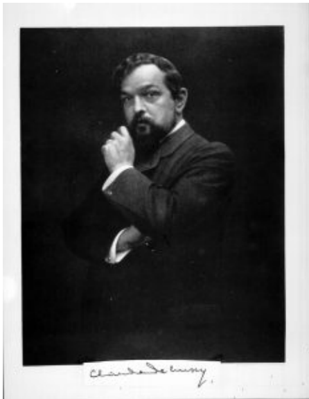
Claude Debussy. Porträtfotografie eines unbekanntem Autors.

Die auf 95 Minuten konzentrierte Version Constants reduziert die Musik auf ihr tragendes Skelett. Ein Experiment, das zum Vorschein bringt, dass die Raffinesse von Debussys Musik nicht im Klang zu suchen ist. Aber auch mit einer gewissen Gnadenlosigkeit offenbart, dass sich Debussy trotz allen Sträubens nicht aus dem Bann Wagners lösen konnte. Vom Orchester entblößt, erscheinen ganze Strecken in der Musik anämisch ausgetrocknet, beschränkt sich der Reiz des Harmonischen immer wieder auf punktuelle Impulse, muss sich auch die Deklamation der Sänger ohne den Schmelz des klanglichen Flusses behaupten.