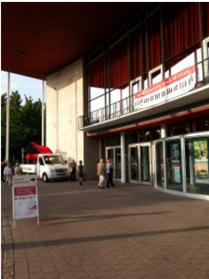
Mülheim: Die Stadthalle im Zeichen des Klavier-Festivals Ruhr.

Versunkenheit, aber auch in seiner klassischen Phrasierung zurück auf Mozart und weist gleichzeitig nach vorne mit seinen harmonischen Rückungen und seinen atmosphärischen Bezügen zu dem geheimnisvollen Basstriller des Kopfsatzes. Der dritte Satz lässt studieren, wie Hamelin zu einer völlig anderen Haltung „umschaltet“, wie er trocken geschlagene Bässe und perlenden Diskant miteinander verbindet und innerhalb der Phrasen unterschiedlich färbt. Der vierte Satz, nicht übertrieben extrovertiert, zeigt die irritierend heftigen Ausbrüche der Forte-Akzente, die Wucht der punktierten Akkorde, auch die Reminiszenzen an die kantable Leichtigkeit des ersten Satzes. Mit der Zugabe, dem Impromptus As-Dur (D 935), bestätigt Hamelin: Hier ist ein Schubert-Interpret am Werk, der es mit den großen Deutungen der Vergangenheit aufnehmen kann und der so leicht niemanden fürchten muss.