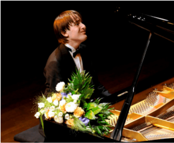
Daniil Trifonov bei seinem Debüt beim Klavier-Festival Ruhr in Düsseldorf

Aber all die grandiosen Kaskaden, die Pranke im Bass und die gleißende Kraft des Diskants, die durchgerauschten Passagen und Arpeggien, die Raserei der Hände und der Triumph ihrer Spannweite über die Grenzen der Physis – alles das macht den jungen Virtuosen noch nicht zu einem Dramatiker, einem Poeten oder einem Lyriker am Klavier, sondern erst einmal zu einem Techniker. Wenn da nicht noch etwas ganz Anderes wäre: Im Allegretto der Skrjabin-Sonate zum Beispiel ist es die Farbe der Bässe, ein trocken-drohendes Staccato, das die Leichtigkeit als trügerisch entlarvt. Es ist die Abtönung der Phrasenenden, die zeigt, mit wie viel Delikatesse Trifonov zu modellieren versteht. Es ist die souveräne Geschmeidigkeit, mit der er sich an das Maestoso im letzten Satz anschleicht: Wie ein Tiger spannt er die Sehnen an, um dann mit voller Kraft abzuspringen.