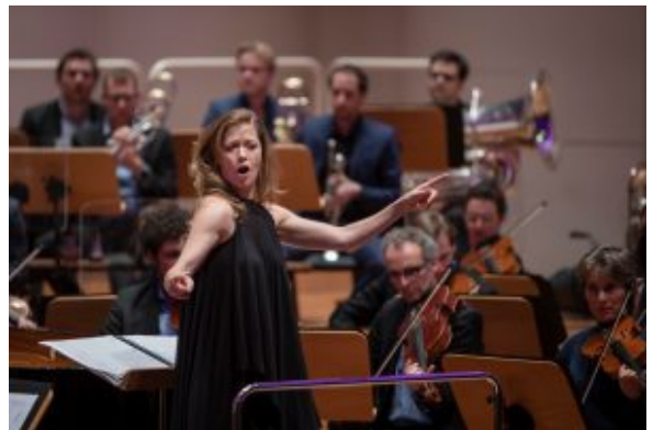
Singen und dirigieren zugleich: Barbara Hannigan gibt alles.