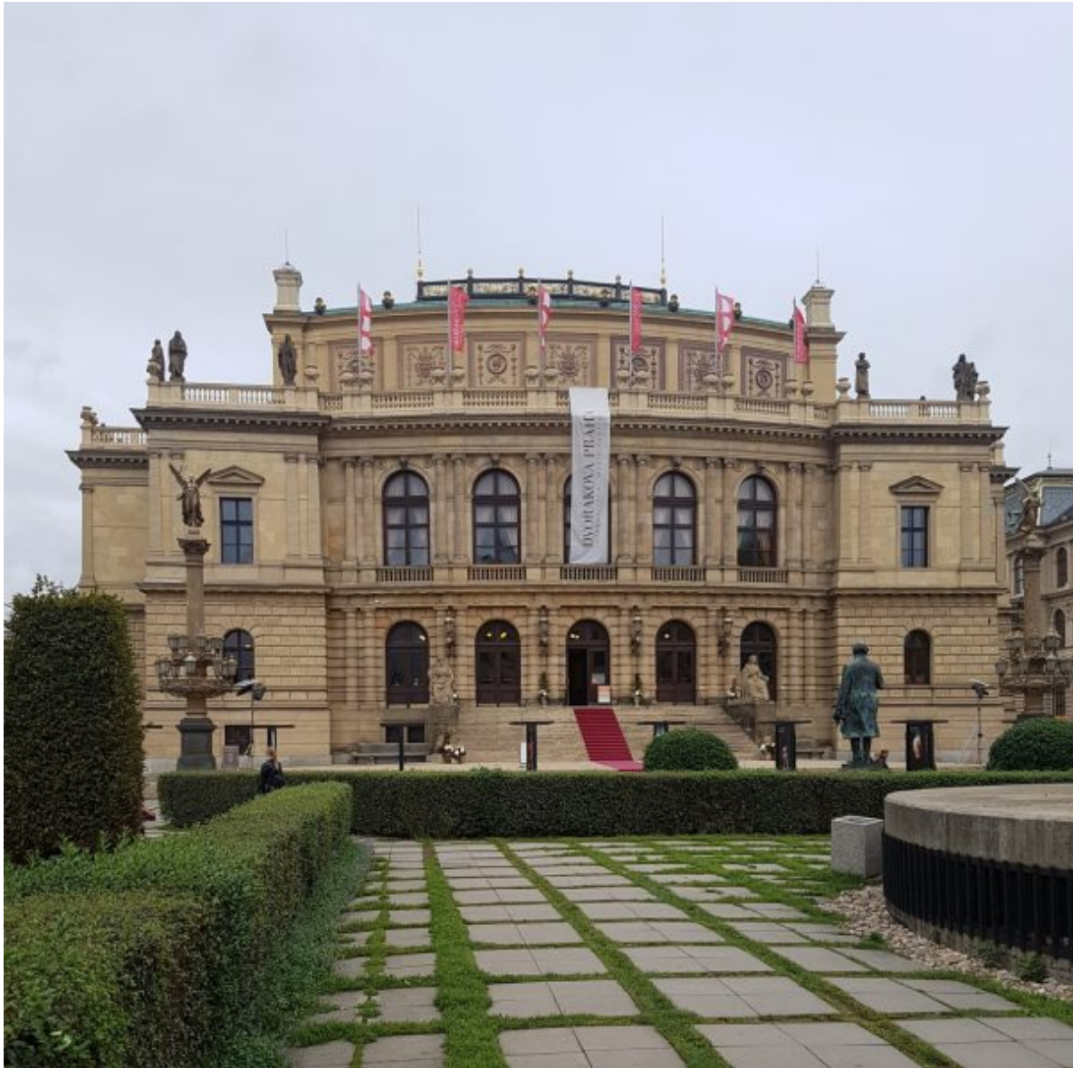
Das Rudolphinum, Prags historischer Konzertsaal und Auftrittsort der Essener Philharmoniker.

sind geschmückt. Drinnen legen Musikerinnen und Musiker ihre Konzertkleidung an, Notenpulte und Stühle auf dem Podium werden zurechtgerückt. Üblicher Betrieb in einem Konzerthaus – und doch ist die Stimmung anders, festlicher, gespannter.