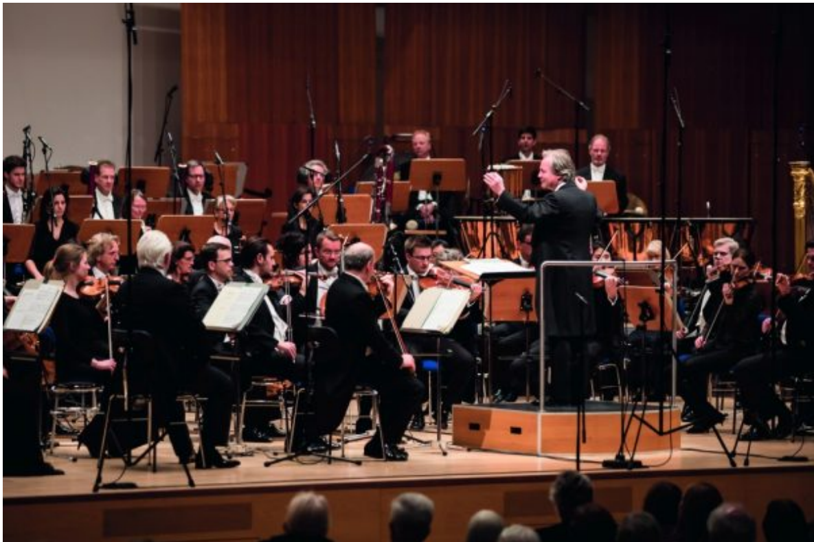
Die Duisburger Philharmoniker.

geschrieben von Werner Häußner | 24. März 2026