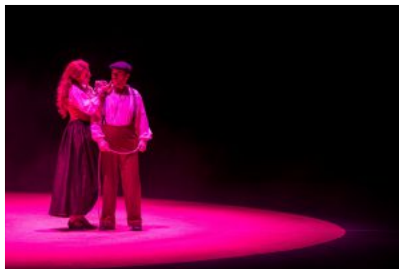
Wenn Carmen und José sich unterhalten, wechselt das Licht auf violett

Die Personenführung ist stark aus der Musik heraus entwickelt. Chöre und Ensembles bewegen sich wie nach einer Choreographie: Sie greifen Schwung und Rhythmus von Bizets Partitur auf und treiben das Rad der Handlung unentwegt nach vorne. Zuweilen frieren die bewegten Tableaus aber auch zu Standbildern ein, die mit weißem Licht wie aus dem Dunkel der Aalto-Bühne heraus geschnitten scheinen. Überhaupt kommt der Ausleuchtung des Raums hier große atmosphärische Bedeutung zu (Licht: Alex Brok).