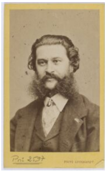
Johann Strauß in einer historischen Fotografie von Fritz Luckhardt

Silvester und Neujahr sind Strauß-Tage: Zahllose Konzerte weltweit lassen die Walzer, Polkas, Märsche und Quadrillen des „Walzerkönigs“ erklingen, beschwören vermeintliche Glanzzeiten, vergoldet von den Melodien von Johann Strauß Vater und Sohn und dessen Brüdern Josef und Eduard. Das Wiener Neujahrskonzert hat sich seit Beginn der Radio- und später Fernsehübertragungen 1959 zum weltweiten Ereignis entwickelt, das in diesem Jahr von über 100 Stationen ausgestrahlt wurde.