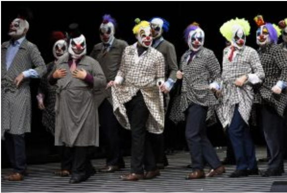
Die Höflinge als eine Schar von Horrorclowns

Konfetti und Kamelle fliegen zwar nicht, dafür aber viele bunte Luftballons, von denen viele geräuschvoll platzen. Sind sie Symbol für die Illusionen der Hauptakteure? Sie verbreiten jedenfalls eine konträr zum Stück stehende Kindergeburtstags-Atmosphäre.