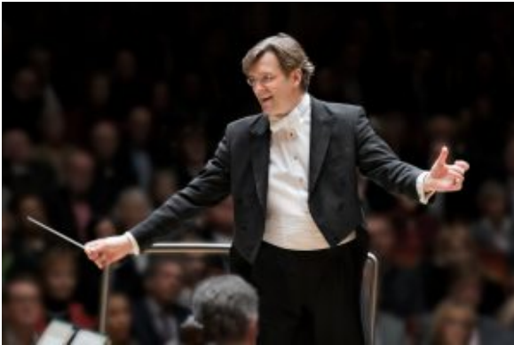
Der Essener GMD Tomas Netopil.

Netopil nur zum Teil auf eine solche – überspitzt gesagt – technizistische Lösung ein. Er lässt Wut und Depression, Melancholie und Aufschrei zu, ohne in jedem Moment auf plastische Balance, auf das „strukturelle“ Hören zu achten.