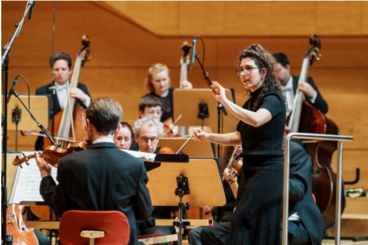
Die Dirigentin Nil Venditti.