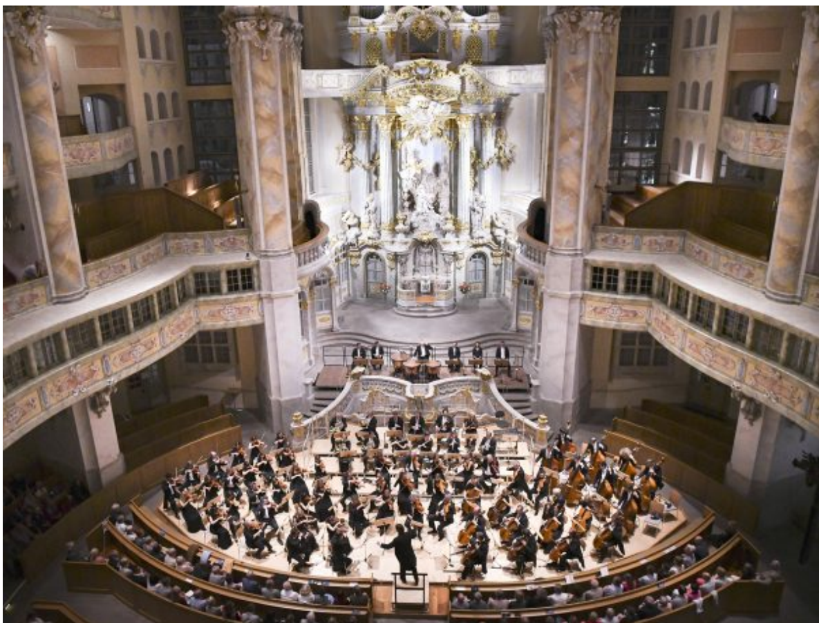
Die Essener Philharmoniker in der Frauenkirche Dresden.

Genau so, mit Passion und Blick in die Tiefe, gehen die Essener Philharmoniker das Werk an. Die düster-unwirschen tiefen Streicher, der erste Ausbruch in den Trompeten, die ein lichtet Tongewölbe aufspannende Oboe, der markante Rhythmus, der unverkrampfte Fluss von Motiven und Themen: das Orchester spielt nachdrücklich und energisch. Die Bläser-Einleitung des zweiten Satzes gelingt gelöst und schwingend, im dritten Satz lebt der Rhythmus markant und locker zugleich. Netopil fordert Saft in den Tönen und zupackende Kraft, nimmt aber das Orchester auch zurück, wenn es den hohen, aber relativ kurz gebauten Saal zu überfordern droht. Keine leichte Aufgabe für die Musiker, die sonst in der offenen, freien Akustik der Essener Philharmonie spielen.