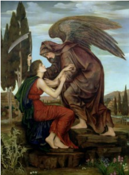
„Der Todesengel“. Gemälde von Evelyn de Morgan (1881).

Über eine Stunde währt dieses gewaltige Lamento, nur von wenigen lichten Momenten aufgehellt. Doch so kompakt die emotionale Seite des Stückes wirkt, so übersichtlich ist die formale Gliederung. Suks Bekenntnismusik kreist nicht um sich selbst, hat also gewissermaßen Hand und Fuß. Mag auch die eine oder andere Steigerung das Plakative streifen, ist der Sinfonie doch ein ganz eigener Ton zu bescheinigen. Mit Mahler, wie oft geschrieben, hat das wenig zu tun, Dvořáks Sprache wiederum spiegelt sich lediglich in einigen Zitaten (aus dem Requiem, aus „Rusalka“). Und doch: „Asrael“ ist trotz aller Originalität kein Schlüsselwerk der Musikgeschichte.