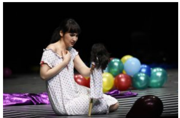
Gilda (Christina Pasroiu), Tochter des Rigoletto

Überzeugend gelingt dagegen die Zeichnung der Gilda, die endlich einmal nicht in einem käfigartigen Verhau auf ihren Vater warten darf, sondern als selbstbewusster Teenager in modischer Jeans auf dem heimischen Sofa lümmelt.