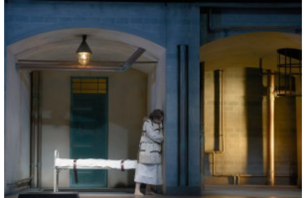
Bitteres Ende in der Gummizelle.

wie anrührend. Bis ihr Dr. Freud eine Spritze geben lässt – sie sinkt hernieder, ob schlafend oder sterbend oder im Wagnerschen Sinne erlöst, bleibt unserer Fantasie überlassen.