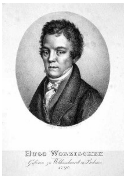
Jan Vaclav Hugo Vorisek.

Dennoch: Mahlers Erste war ein Versprechen, und der neue GMD wird, das war zu hören, sich mit einem technisch hochklassigen, sehr kooperativ wirkenden Orchester und dem eigentlich entgegenkommenden Raum sicher noch intensiv anfreunden. Das Potenzial ist da – im Essener Neubeginn knospt der Zauber.