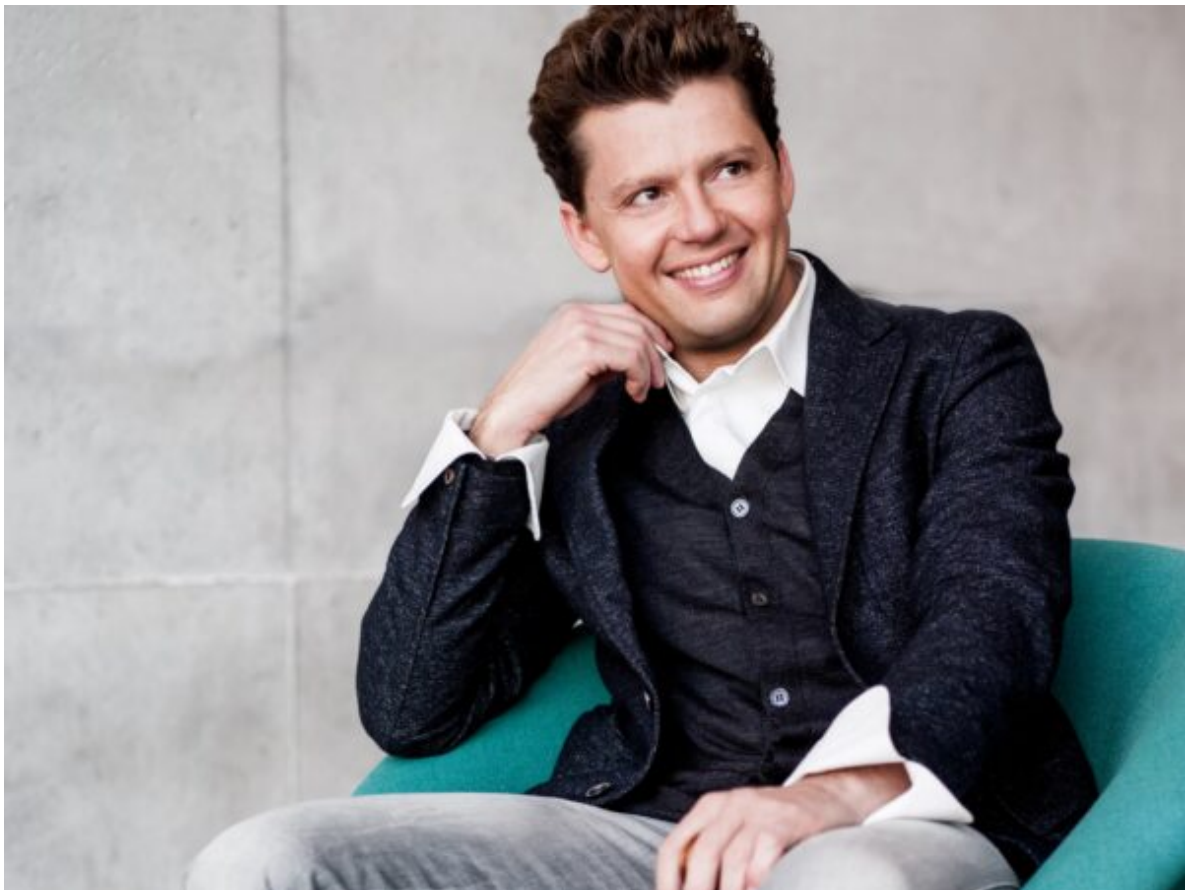
Mit Blick auf die leisen Töne: Dirigent Julian Rachlin.

der Inspiration, nicht jedoch eine Ressource von Musik. Die Sinfonie hat keine folkloristischen Züge, das thematische Material stammt nicht etwa aus „schottischer“ Folklore, die der gebildete Berliner als „vulgären, verstimmtten Müll“ schmähte. Es gibt wundervolle, lyrisch ausgekostete Stimmungen, es gibt erhabenes Pathos und lebhaft tänzerische Passagen. Alles ist jedoch in eine Form gebracht, die eher an die Wiener Klassik als an ein schroff-schottisches Landschaftsgemälde erinnert. Der Vergleich mag gewagt sein – aber die edle Einfalt und stille Größe erinnert ein wenig an die Zeichnungen, in denen der Komponist selbst die wilden Landschaften einfing.