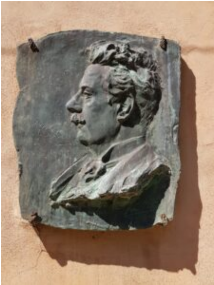
Gedenktafel für Giacomo Puccini in seinem langjährigen Wohnort Torre del Lago.

In der Messe findet sich keine Spur der späteren Opernmusik zu religiösen Momenten, etwa des falschen Pathos' des „Te Deum“ in „Tosca“. Dafür lassen sich zwei Beobachtungen machen: Puccini zeigt seine Stärken als Dramatiker, denn die schildernden Teile etwa des Credo wirken inspirierter als die reflektierend theologischen Passagen. Und er lässt sich nicht nur von Ausdruckskonventionen bestimmen. Das zeigt sich bereits im kontemplativen „Kyrie eleison“: Der Opernchor des Aalto-Theaters gibt ihm gemeinsam mit dem Philharmonischen Chor Essen pastorale Leichtigkeit, hebt aber auch den Kontrast zum „Christe eleison“ mit seinen Marcato-Männerstimmen heraus.