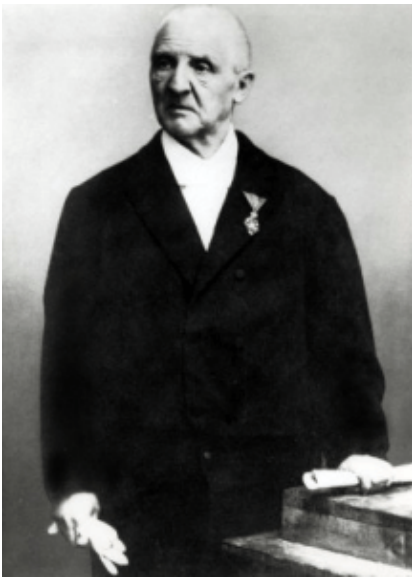
Anton Bruckner auf einer historischen Photographie.

Die große Klammer des Kopfsatzthemas ist ja nur die auffälligste dieser motivischen Verwandtschaften, die sich bis ins Detail hinein nachweisen lassen. Ganz zu schweigen von den Kombinationen von Formprinzipien wie Sonate und Fuge oder von der strukturellen Bedeutung des Rhythmus für die Wandlung von Themen.