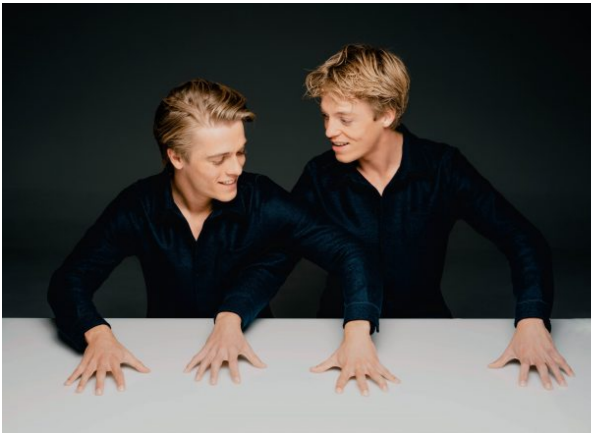
Arthur und Lucas Jussen.