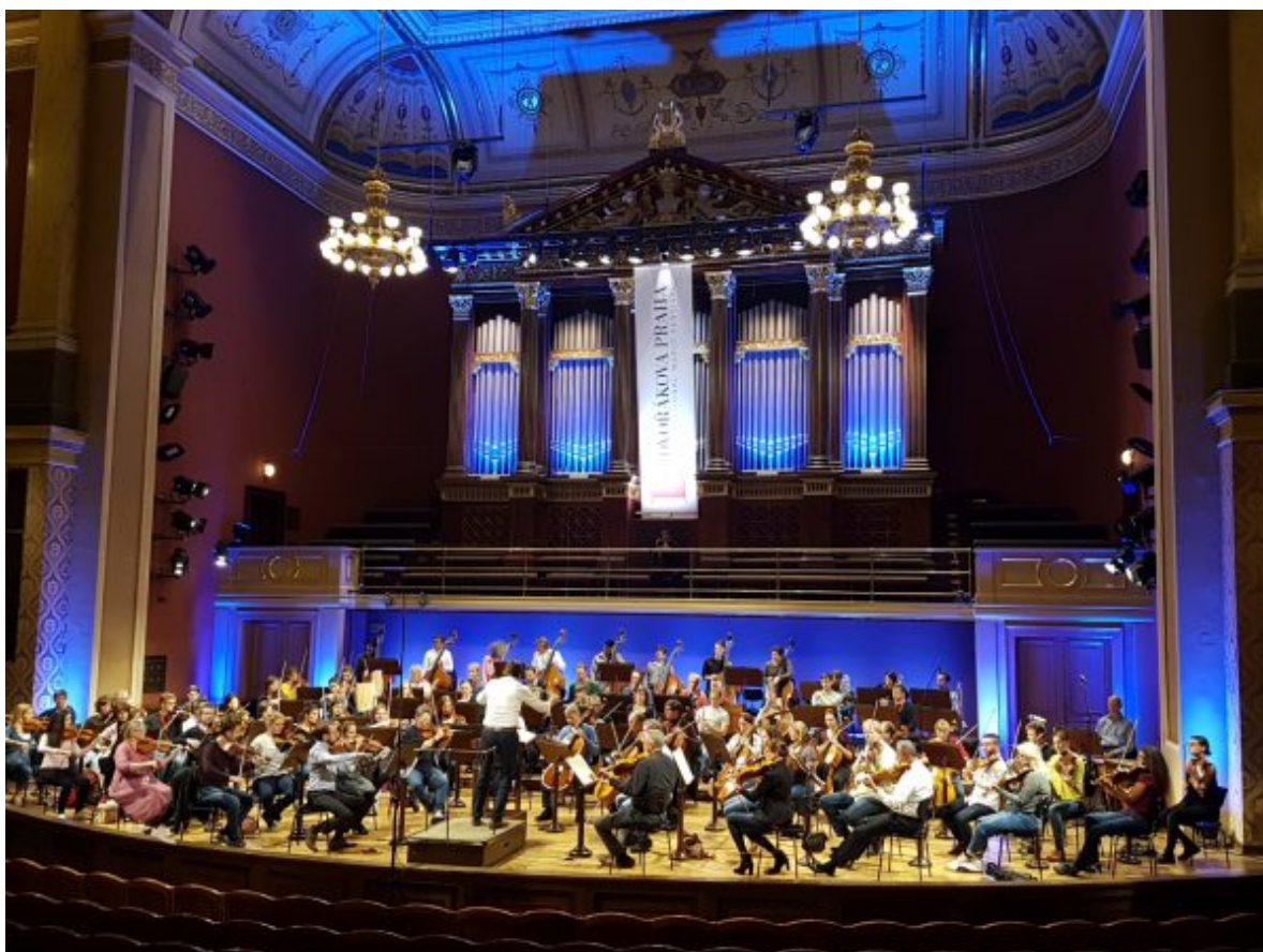
Probe im Rudolphinum in Prag.

Essener Philharmoniker mit der Herausforderung des Klangs umgehen, mit jenem „böhmischen“ Ideal, das mit weicher, leuchtender Streicherintonation und schmeichelnden Bläsern identifiziert wird? Netopil hat, wie er im Gespräch verrät, in den Proben auf diesen Klang hingearbeitet, ohne ihn den Musikern überstülpen zu wollen: keine Imitation, aber eine Annäherung.