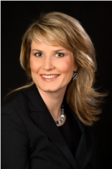
Camilla Nylund.

So etwas nennt sich Pech: Zum zweiten Mal musste Anja Harteros, „Residence“-Künstlerin der Philharmonie Essen, ein Konzert absagen. Eine hartnäckige Krankheit hat ihren Auftritt unmöglich gemacht. Als Einspringerin kam Camilla Nylund an die Ruhr – und die blonde Finnin als „Ersatz“ anzusprechen, wäre mehr als ungerecht.