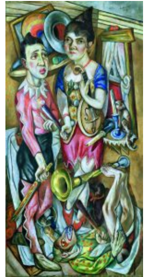
Max Beckmann: Fastnacht (Carnival), 1920. Tate, London, Ankauf mit Unterstützung des Art Fund und der Friends of the Tate Gallery & Mercedes Benz (U. K.) Ltd. 1981 (© VG Bild-Kunst, Bonn 2018, Foto: Tate Images, London)

Die Ausstellung „Welttheater“ umkreist und untersucht jetzt im Potsdamer Museum Barberini dieses zentrale Thema im Schaffen des Künstlers mit 112 Werken. Es ist eine Schau mit Leihgaben aus aller Welt. Museen aus London und New York, Dresden und Düsseldorf sowie viele ungenannte Privatsammler haben kostbare Werke beigesteuert.