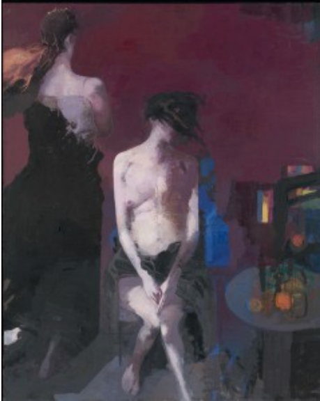
Arno Rink: "Lots Töchter", Öl auf Leinwand, 2007

Betrachter, dass diese eher stille und gut gemeinte, aber künstlerisch noch unausgereifte Sammlung von ziemlich konventionellen Bildern einen solch lauten Streit hervorrufen kann?