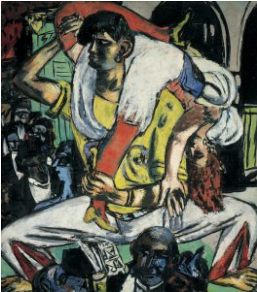
Max Beckmann: „Apachentanz“, 1938. Kunsthalle Bremen – Der Kunstverein in Bremen