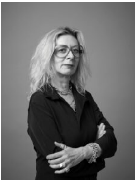
Portrait Monica Bonvicini

Monica Bonvicini räumt sich den Weg frei. Die meisten ihrer überdimensionalen Arbeiten kann sie seit Jahren nicht zeigen, aber wenigstens herbeizitieren: In einer Wort-Collage erklingen um die 2000 Titel von Werken, die sie bisher geschaffen hat. Sprache wird Kunst, Kunst wird Sprache. Aber auch Erschütterung und Provokation, Rätsel und Geheimnis.