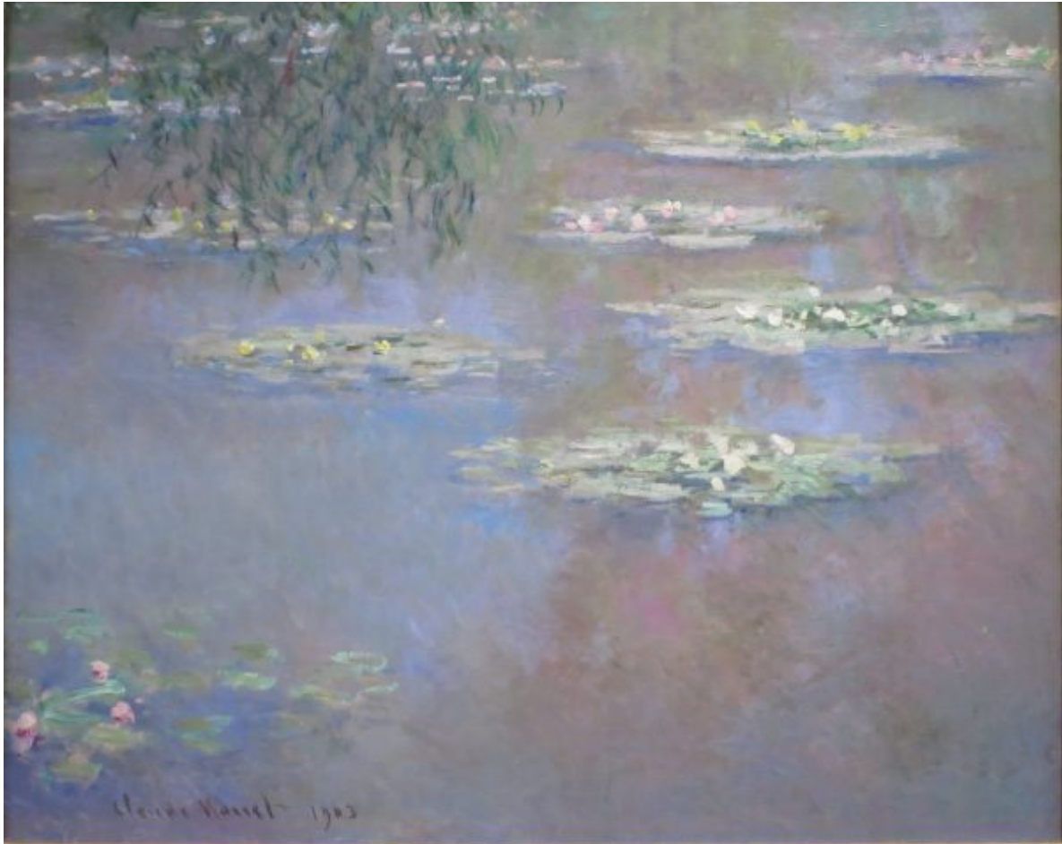
Claude Monet: „Seerosen“, 1903, Öl auf Leinwand (The Dayton Art Institute, Ohio)