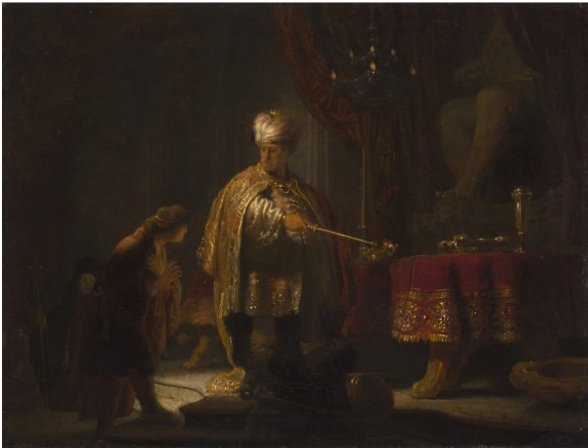
Rembrandt Harmensz van Rijn: „Daniel und Kyros vor dem Götzenbild des Bel“, 1633, Öl auf Holz, 23,5 x 30,2 cm

nirgendwo ein Hauch von Kritik oder Selbstbefragung. Die Künstler, die im Hafen von Amsterdam gelegentlich Menschen aus der Fremde erblickten, den Orient als Mode auffassten und sich in ihrem schicken Heim mit fernöstlichen Accessoires umgaben, verdienten gutes Geld damit, niederländische Kaufleute in orientalische Gewänder zu hüllen und sie darzustellen, als würden sie durch fernen Fantasie-Landschaften flanieren. Der Orient war eine geografische Fata-Morgana und erstreckte sich von Ägypten bis nach Japan.