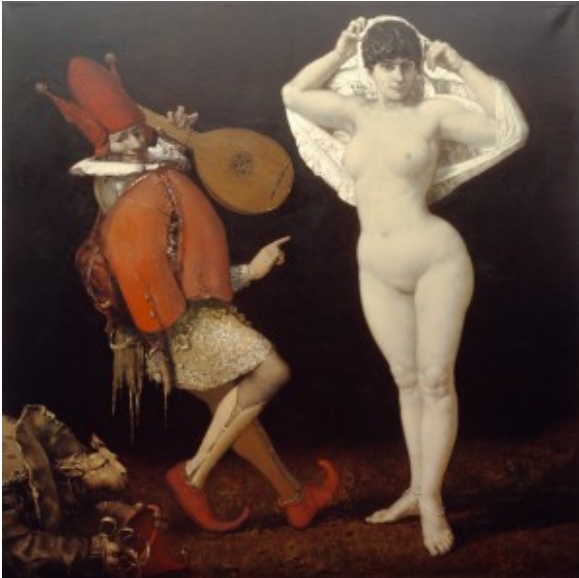
Werner Tübke: "Der Narr und das Mädchen", Öl auf Leinwand, 1993/94