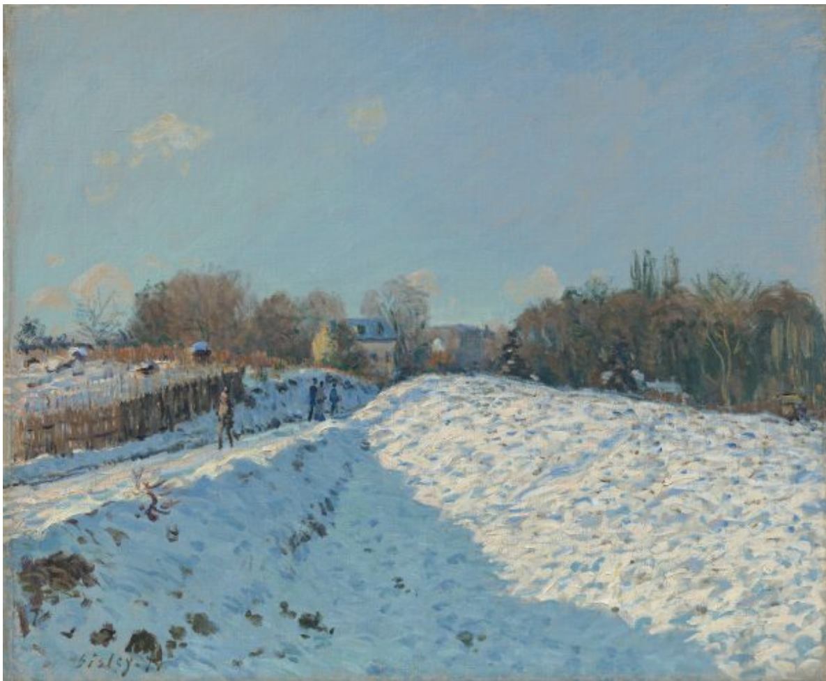
Alfred Sisley: „Schnee in Louveciennes“, 1874, Öl auf Leinwand, 54 x 65 cm, Sammlung Hasso Plattner

Dass Hasso Plattner die Impressionisten besonders wertschätzt, konnte man ahnen. Schon die Eröffnung des von ihm mit einer beträchtlichen Geldsumme gesponserten Museums vor drei Jahren startete mit einem opulenten Überblick über die französischen Impressionisten. Und kurz bevor Corona die Kunst allerorten zum Stillstand brachte, legte das Barberini mit einer viel beachteten Monet-Ausstellung nach. Viele der dabei gezeigten Werke waren einem anonymen Privatsammler zugeordnet. Jetzt ist klar, dass sie Plattner gehören. Vor allem natürlich die 34 (!) Monets, die den Grundstock der 103 Bilder umfassenden Impressionisten-Schau ausmachen.