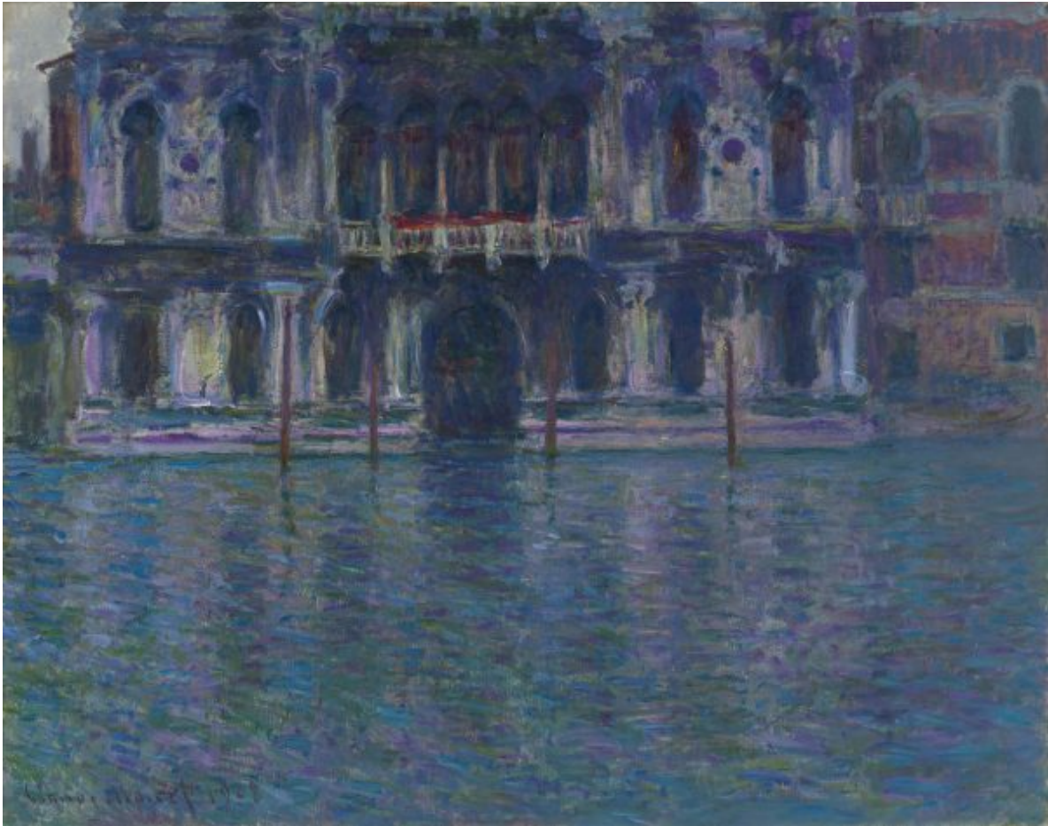
Claude Monet: „Der Palazzo Contarini“, 1908, Öl auf Leinwand (Privatsammlung)

Um nicht am deutsch-französischen Krieg teilnehmen zu müssen, lebt er eine zeitlang in Holland und vergnügt sich zwischen Windmühlen, Grachten und Tulpenfeldern. Später, in Argenteuil, blickt er auf die sich im Wasser der Seine spiegelnde Natur. In Vétheuil beobachtet er den Eisbruch auf dem zugefrorenen Fluss, den Sonnenuntergang, die Wiesen und Weizenfelder, in denen sich, kaum erkennbar, Kinder fröhlich tummeln und von der Natur regelrecht verschluckt werden. Er reist nach Venedig und malt den sich im Canale Grande spiegelnden Dogenpalast. An den Küsten Nordfrankreichs sieht er von steilen Klippen hinaus auf die stürmische See und schafft realistisch-dramatische Szenerien.