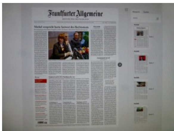
Die FAZ-Titelseite vom 6. Januar 2016

Nun habe ich schon eine etwas längere Geschichte mit dem bedruckten Zeitungspapier. In meinen journalistischen Berufsanfängen habe ich noch Mettage und Bleisatz kennen gelernt, habe noch etliche Jahre auf herkömmlichen Schreibmaschinen gehackt, bevor dann nach und nach all die technischen Neuerungen Einzug hielten. Anfangs kamen einem selbst Faxe vor, als stammten sie von Zauberhand. Dann der blitzsaubere Lichtsatz mit allerliebsten zurechtgeschnittenen Textfähnchen – und, und, und. Bis man dann schließlich im Internet wühlte, wie es alle anderen Berufsgruppen auch taten.