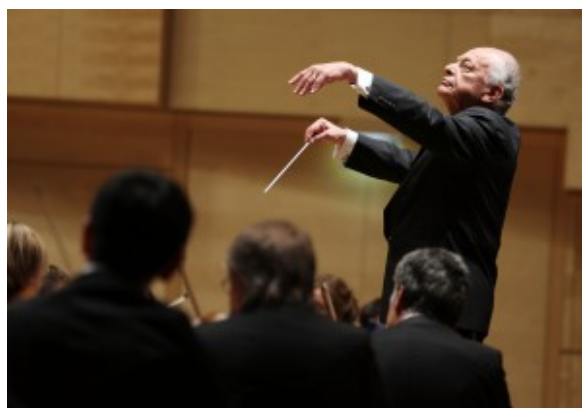
Lorin Maazel in der Philharmonie Essen, 16. September 2012.

Den „Tristan-Akkord“ selbst brachte zur Eröffnung der Konzertreihe kein Geringerer als Lorin Maazel zum Klingen: Kaum im Amt als Chefdirigent der Münchner Philharmoniker, kam er mit seinem neuen Orchester, den Münchner Philharmonikern, in den Alfried-Krupp-Saal. Immer wieder war er in Essen gern gesehen: 2005 und 2008 mit dem New York Philharmonic Orchestra, 2010 mit den Wiener Philharmonikern, 2011 mit Mahlers Fünfter und dem Philharmonia Orchestra London. Nach glänzendem Erfolg mit Mahler in München und Bruckner beim Lucerne Festival brachte Maazel nun Schubert, Wagner und Strauss mit – und die Münchner Philharmoniker zu ihrem Debüt in Essen!