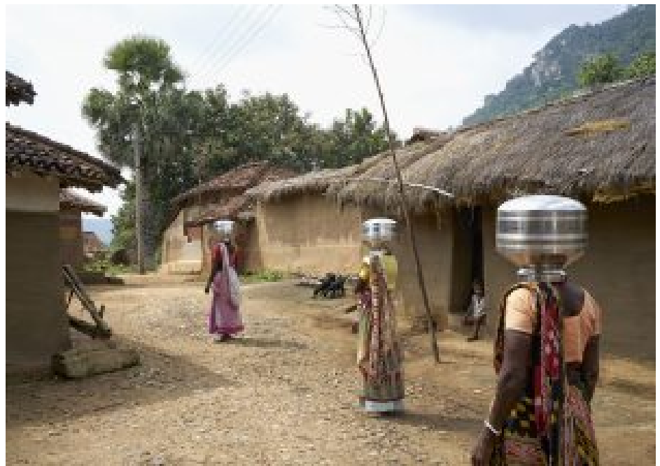
Bild aus der Fotoserie „The Last Drop – Indien, Westbengalen“ von Anja Bohnhof (2019)

Hier wäre übrigens, ganz beiläufig, die Stelle, an der man sich zudem über den Einfluß der Kuratoren auf Kunstproduktion und –präsentation ein paar kritische Gedanken machen könnte, aber das führte im Moment wohl zu weit. Gleichwohl: Müßte man nicht auch für sie, die Kuratorinnen und Kuratoren, ein warmes Plätzchen in der Bundeskunsthalle reservieren?