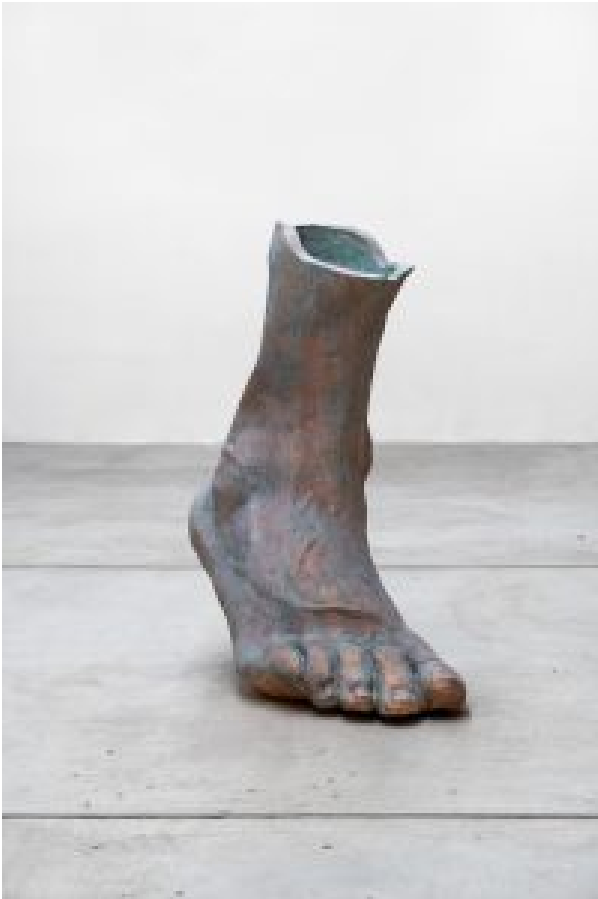
Zuzanna Czebatul: „Siegfried's Departure“ (2018)