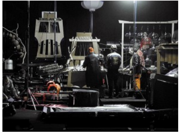
Harry Partch: Delusion of the Fury, Probenszene.

Den Beginn markiert in dieser Saison das Musiktheater des Amerikaners Harry Partch, ein Stück zwischen Traum und Wahn namens „Delusion oft he Fury“. Mit vom Komponisten eigens gebauten Instrumenten und von ihm aufgezeichneten Tonsystemen. Das Bühnenmodell, das im Programmbuch zu sehen ist, wirkt wie aus dem Baukasten eines Futuristen. Das Original gibt's dann in Bochums Jahrhunderthalle zu bestaunen.