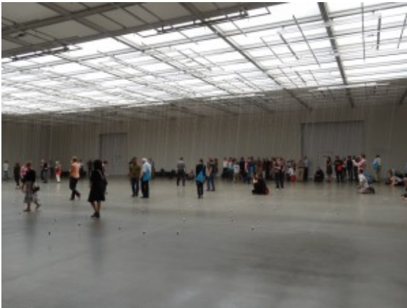
Installation „Nowhere and everywhere at the same time Nr.2“

Das edle Museum Folkwang zeigt zwei Arbeiten des Choreographen William Forsythe, der seit langem Tanz und Bildende Kunst auf gleiche Ebenen bringt. Zunächst kann man sich als Besucher in einer