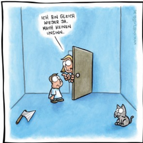
Abgründiges aus der Reihe NICHTLUSTIG von Joscha Sauer, 2004