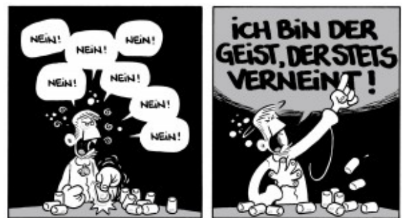
Faust von Flix, 2010

gerieten „Handtuchbilder“ aus der Vogelperspektive, die viele leicht bekleidete Frauen im Freibad auf ihren Handtüchern liegend zeigen. Das eine Männchen im Bild, das von so viel Weiblichkeit geradezu erschlagen dumm dasteht, muss natürlich sein, sonst wäre das Bild nur ein Bild und noch keine Geschichte. Aber Comics und Cartoons erzählen nun einmal abgeschlossene Geschichten, und seien sie noch so kurz. Auch die schnell hingeworfenen Animationszeichnungen von Flix, die in einer Vitrine liegen und ein bisschen an altmeisterliche Skizzenbücher denken lassen, zeugen von dessen Könnerschaft.