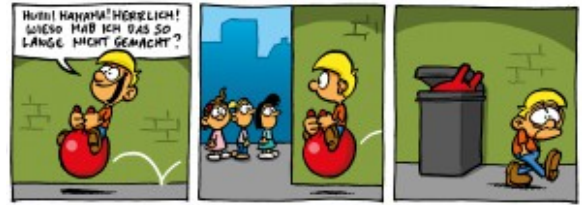
„Frühreif“-Dreibilderstrip von Ralph Ruthe, 2014